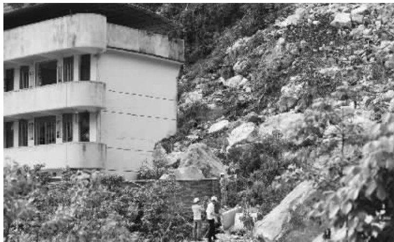
广西融安山体滑坡造成 21 名正上课小学生受伤 4 月 21 日,在广西融安县浮石镇六寮村小学受灾现场,国土部门在现场勘察。目前,21 名受伤的小学生全部在县人民医院和县中医院救治,其中 7 人伤势较重,均无生命危险。事故原因调查等相关工作正在进行中。 新华社发

据新华社北京 4 月 21 日电 全国土地利用数据预报结果显示,截至 2015 年末,全国耕地面积为 20.25 亿亩,年内净减少耕地面积 99 万亩。 21 日公布的《2015 中国国土资源公报》显示,依据全国土地利用数据预报结果,截至 2015 年末,全国耕地面积为 20.25 亿亩,全国因建设占用、灾毁、生态退耕、农业结构调整等原因减少耕地面积 450 万亩,通过土地整治、农业结构调整等增加耕地面积 351 万亩,年内净减少耕地面积 99 万亩;全国建设用地总面积为 5.78 亿亩,新增建设用地 760 万亩。 公报称,2015 年,国土资源部门严守耕地保护红线,全国 106 个重点城市周边永久基本农田划定工作取得积极进展。本年度,国土资源部会同农业部,部署开展 106 个重点城市周边永久基本农田划定工作,按照城镇由大到小、空间由近及远、耕地质量由高到低的顺序,以城镇周边永久基本农田划定为重点,分步推进永久基本农田划定工作,106 个重点城市周边永久基本农田划定工作取得积极进展。