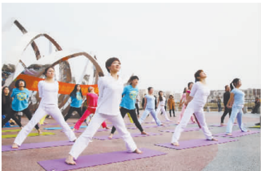
改造后的驸马沟公园成为人们休闲的好去处。这是女士们在此练瑜伽,引领市民开展健身运动。

领导小组,出台实施方案和考评细则,细化工作措施,扎实稳步推进。制度落实年工作分为动员部署、学习对照、整改落实、督导检查四个阶段进行,各单位要对进展情况做到每月一报告、季度一小结、半年一总结。项城市纪委组成督导组加强日常督导、集中督导和评议考核。 为做好这项工作,项城市纪委强化措施,加大监督检查和通报问责力度,适时统一进行法规制度考试,抓实制度学习、宣传、执行、考核落实等关键环节,确保制度落实年工作取得实效。(蒋钦中)