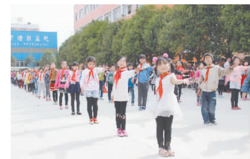
4月13日,项城市英华学校以学生跳广场舞展示该校素质教育工作的丰硕成果。学校鼓励学生健康发展,推动素质教育深入开展。

本报讯 为了稳定乡镇干部队伍,调动乡镇干事创业热情,激励广大干部扎根基层、服务群众,4月25日,项城市召开了乡镇工作补贴工作会议,标志着全市乡镇工作补贴发放工作正式启动。 本次实施乡镇工作补贴范围为乡镇(不含街道)机关事业单位在岗正式工作人员和上级政府长期(6个月以上)派驻乡镇机构的工作人员。按乡镇工作年限划分,5年以下每月200元;6年至10年220元;11年至15年240元;16年至20年260元;21年至25年280元;26年以上300元。 乡镇工作补贴所需经费,按其行政隶属关系和现行经费保障、工资发放渠道解决,从2015年1月1日起执行。于2016年5月底前,最迟不超过今年上半年,将乡镇工作补贴全部落实到位。(张纪友 崔慧卿)