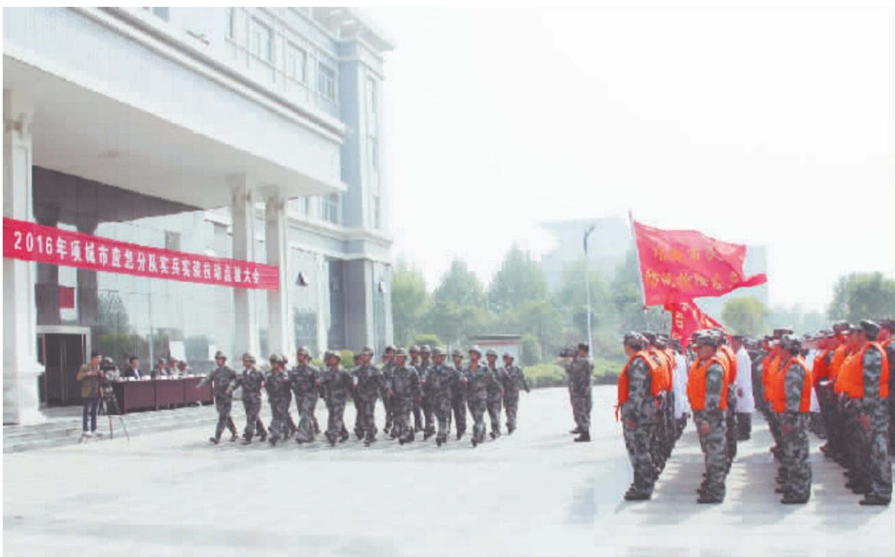
本报讯 为检验民兵应急分队组织和建设情况,进一步加强民兵应急分队的自身素质和应对突发事件的集结反应能力,4月21日,项城市民兵应急分队点验大会在该市人武部召开(如上图)。周口军分区参谋长薛振喜出席并讲话。