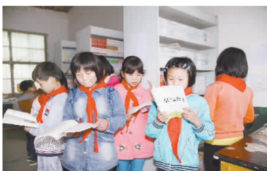
4月23日是世界第21个读书日。更多的市民和中小学生走进图书馆、阅览室,多读书、读好书,享受阅读。

本报讯 项城市首张食品经营许可证于4月22日在项城市行政服务中心食品药品监督管理窗口正式发出,标志着实行食品流通许可证与餐饮服务许可证“两证合一”的新版食品经营许可证在项城市正式启用。 今后,食品经营者具有合法资质的证书,将统一为食品经营许可证,原食品流通许可证、餐饮服务许可证在有效期内仍可使用。新的食品经营许可证有效期5年,且申请人可以通过网络进入“食品药品行政审批及电子监察平台”进行网上申请,极大地提高了企业和经营者的办事效率。食品经营许可证增加了二维码标识,消费者只需扫描二维码,就能查询到许可证的有关信息。(翟磊)