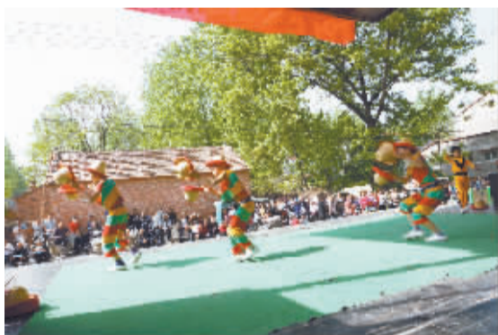
4月13日,项城市杂技学校在官会镇丁营村文化广场演出。据了解,这是该市“文艺下乡”的一部分,该校将在全市所有行政村演出一遍。

政区域界线变更勘定工作,督促各相关部门做好债权债务的确认、转移和接续工作;要完善各项申报程序,做好社会稳定风险评估工作。 项城市委常委、统战部长张文成在会议上希望产业集聚区和相关镇、办,要提高认识,高度重视,顾全大局,把思想和认识统一到省、市重大决策上来,以此次调研为契机,进一步统一思想,形成共识,密切配合,形成合力,做好资源整合和稳定工作。 据了解,按项城市部分行政区划调整方案,此次区划调整涉及郑郭镇、东方办事处、莲花办事处、产业集聚区等单位。本次调整所涉及的行政村(社区居民委员会)原所管辖的行政区域不变,保持土地完成,整体划转,人口归属不变,实行归口管理,原债权债务关系不变,整体移交。(王艳杰)