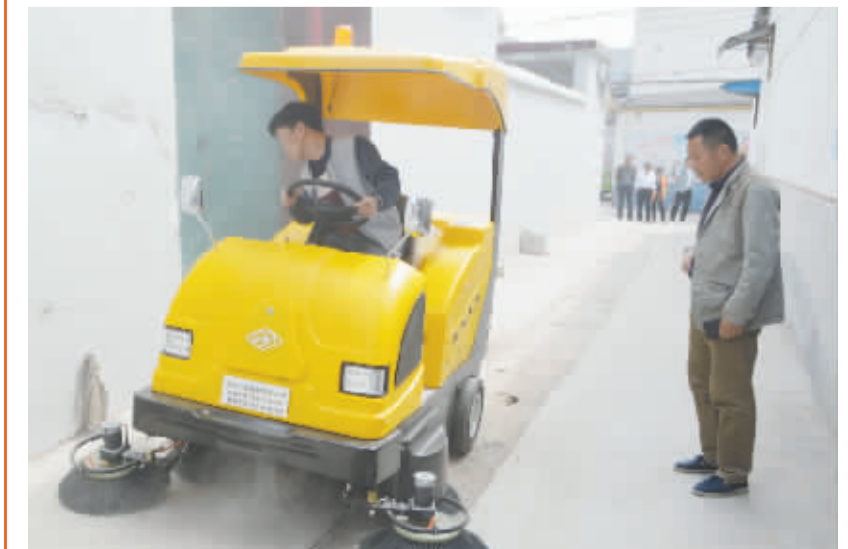
保洁员驾驶保洁车正在认真清理垃圾死角

见成效。目前,该办事处共修建小街小巷道路9条2000余米,铺设和清理下水道80余条3000余米,制作文化墙60余幅600延米,刷写墙体标语2000平方米,开展环境卫生集中整治活动500余次,出动大型机械400辆次,清理各类小广告9200处,清理垃圾18300余方。