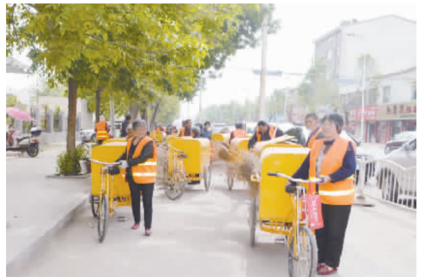
身着统一制服的保洁员覆盖辖区内大街小巷