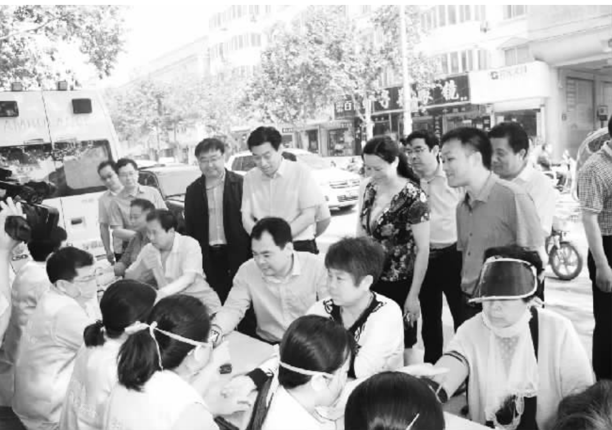
上图:5月6日,为纪念第69个世界红十字日,郸城县组织各乡镇(办)、县直医疗单位的医务人员组成28个红十字志愿者服务队,300余人走上街头,开展义诊和免费送医送药活动。此次活动共接受群众义诊咨询1万余人,免费发放药品近3万元,发放宣传资料1.5万份。图为郸城县领导走上街头参加活动、慰问红十字志愿者。