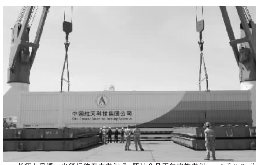
长征七号遥一火箭运往海南发射场 预计6月下旬实施发射

新华社宜昌5月8日电(记者 谭元斌)受长江上游局部地区强降雨影响,7日凌晨起,三峡水库入库流量持续快速上涨,至8日8时,已达17800立方米每秒,为1992年实施此项监测以来历史同时刻最高纪录。 8日2时,三峡水库入库流量上涨至15500立方米每秒,已为1992年以来历史同时刻最高纪录。 受入库流量大幅上涨影响,7日20时至8日8时,处于腾库迎汛阶段的三峡水库坝上水位上涨了0.2米。 中国长江三峡集团公司发布的水情信息显示,8日8时,三峡水库入库流量17800立方米每秒,出库流量13200立方米每秒,坝上水位15656米,坝下水位6483米。