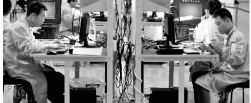
2016年全国职业院校技能大赛在天津开赛

“小桥工程”保障山区儿童的求学安全,改善山区百姓的经济生活,也为土木工程专业的高校学生提供了很好的实践机会。首座茅以升公益桥由清华大学和重庆交通大学两名在校学生设计。