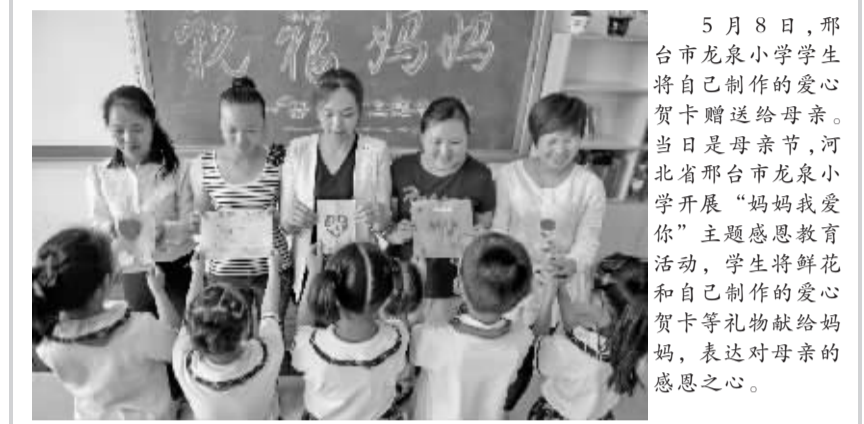
5月8日,邢台市龙泉小学学生将自己制作的爱心贺卡赠送给母亲。