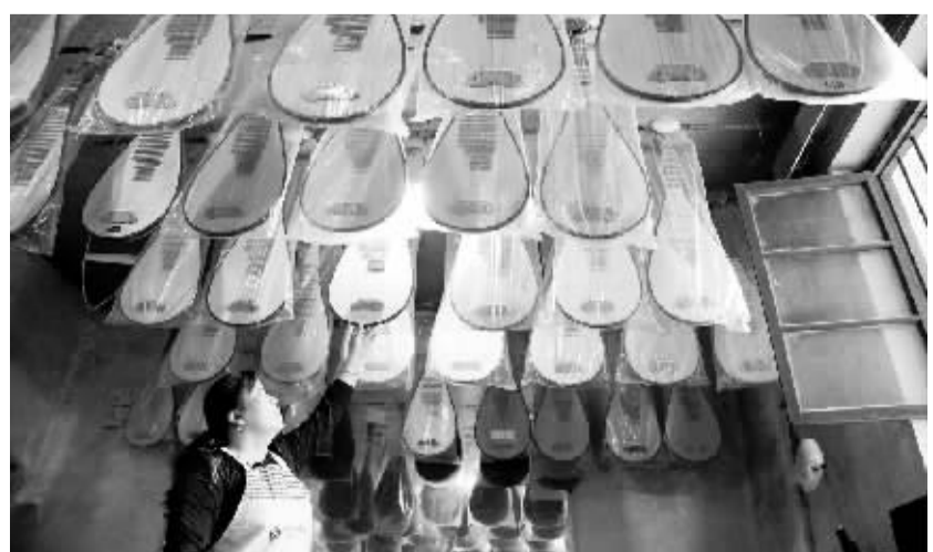
河南兰考:民族乐器助民致富

据新华社天津5月8日电(记者 周润健)苍穹9日将上演本世纪第三次“水星凌日”罕见天象。天文资料显示,“水星凌日”本世纪共有14次,但我国公众能观测到的只有几次而已。 所谓“水星凌日”是指水星从太阳表面缓缓滑过的现象。与日月食类似,此时太阳——水星——地球位于同一直线。由于水星比太阳小得多,“凌日”时,水星在太阳表面就像一个黑点。 人类历史上第一个预告“水星凌日”的人是德国天文学家开普勒。他在1629年预言:1631年11月7日将发生稀奇天象——“水星凌日”。到了那一天,法国天文学家桑迪在巴黎亲眼目睹到有个小黑点(水星)在日面上由东向西徐徐移动。从1631年至2003年,共出现50次“水星凌日”,其中发生在11月的有35次,发生在5月的仅有15次。每100年,平均发生“水星凌日”13.4次。