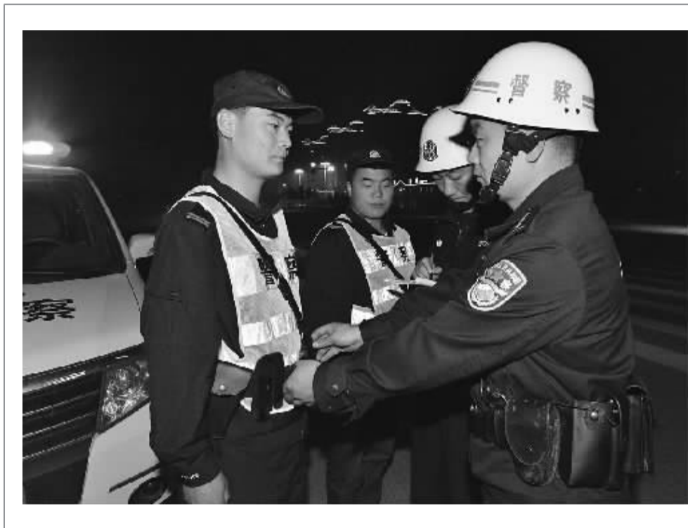
为规范民警执勤、执法行为,连日来,扶沟县公安局督察大队采取现场查、及时到、重点访、快处理等措施,加大监督管理力度,进一步提升公安队伍执法形象。图为5月3日,督察人员对夜间执勤民警进行现场督察。

本报讯 (记者 徐如景 通讯员 白洁 马娜)近日,川汇区检察院多措并举,深入学习《中国共产党廉洁自律准则》《中国共产党纪律处分条例》(以下简称《准则》《条例》),让廉洁自律规范内化于心、外化于行。