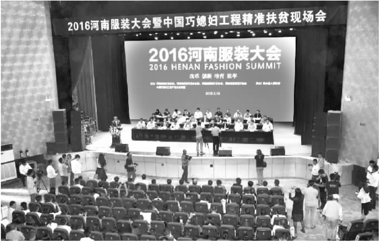
5月19日, 全国服装界瞩目的2016年河南服装大会暨中国“巧媳妇”工程精准扶贫现场会在商水县隆重举行。来自全国1000多家服装行业精英齐聚一堂, 共谋扶贫工作、共话服装发展, 同心协力, 为实现“衣服天下”梦而不懈努力。