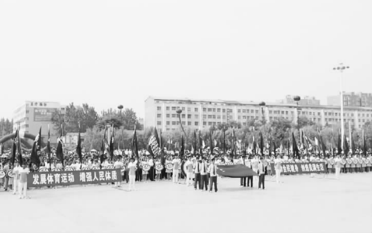
5月12日, 商水县2016全民健身月活动启动仪式暨第三届全民运动会在商水阳城公园内隆重举行。来自全县的2800余名运动健儿、全民健身爱好者及民间体育爱好者参加了太极拳、广场舞、健身操、盘鼓等健身表演。