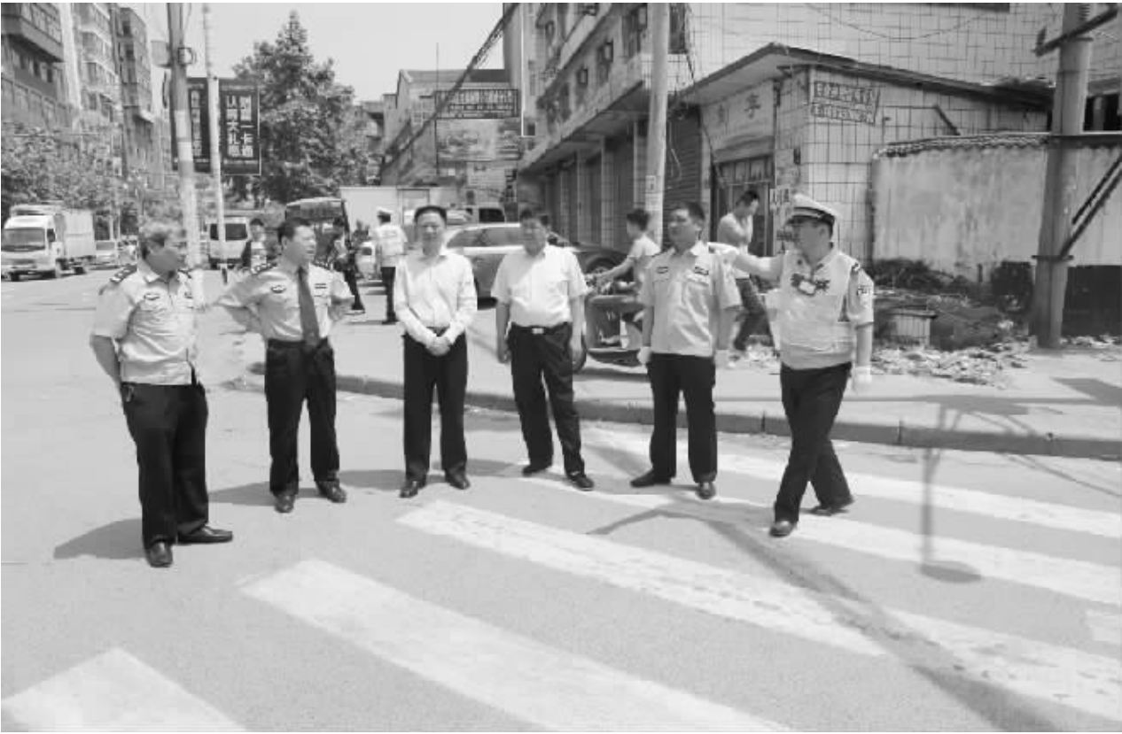
为进一步推进城市精细化管理和“三城联创”工作，郸城县交警大队对县城主要路段沿街违停车辆、店外经营及私搭乱建、活动棚子进行集中清理、整治，对行人、机动车不按规定行驶，车辆违停停放、无证驾驶、遮挡号牌等交通违法行为进行严厉查处。图为郸城县领导走上街头查看城区交通综合治理工作开展情况。