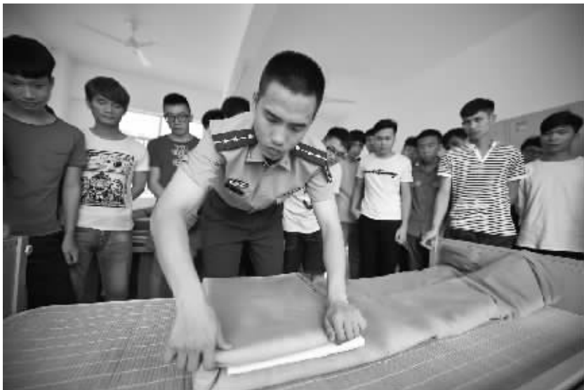
大学生体验军旅生活 5月21日,大学生们在观看一名军官整理内务。2016年全国夏季征兵工作已经全面展开。为更有效地开展征兵工作,激发大学生参军热情,海南省军区某通信团举办“大学生赴军营体验日”活动。200名有应征入伍意向的海南高校学生进入军营进行参观体验,感受军旅生活。

“北京市出台第三阶段、第四阶段、第五阶段的油品地方标准,分别在2005年、2008年、2012年。”吴迪表示,在北京实施“京六”之际,根据全国油品标准提升进度,2017年1月,全国范围将全面实施“国五”标准的汽柴油。 据了解,油品标准升级的最大获益方是在用车。北京市环保局表示,从第五阶段到第六阶段油品的精准减排效果的测算,目前还处在实验阶段;平均而言,油品标准每升级一个阶段,能够使得在用车污染排放下降15%—20%。 另据5月20日召开的京津冀及周边地区大气污染防治协作小组第六次会议,北京市将紧盯“车油路”,加大对高排放车的治理,全方位削减机动车污染排放。