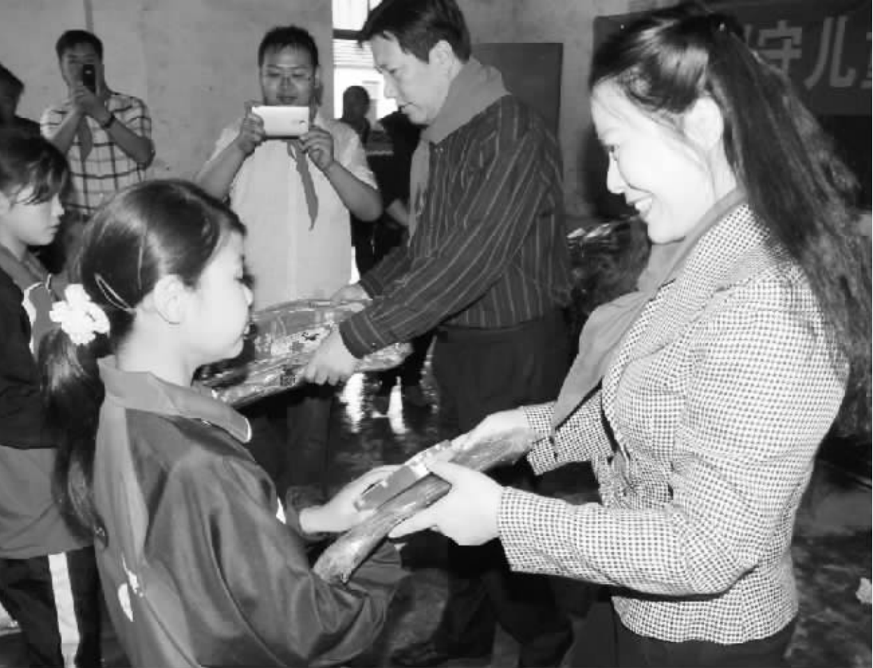
“六一”儿童节前,佳利集团与周口报业传媒集团共同推出“关爱留守儿童”送温暖活动,为淮阳县冯塘乡刘庄村小学的孩子送去了书包、文具等。图为活动现场。