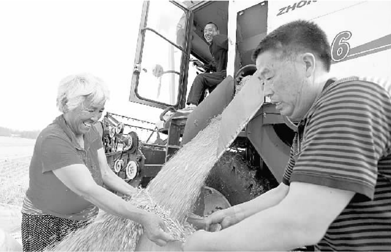
眼下,全市各地小麦已经成熟,农民们抓住晴好天气抢收小麦,确保夏粮颗粒归仓,丰收的喜悦溢于言表。图为商水一户农民正在联合收割机旁收获小麦。