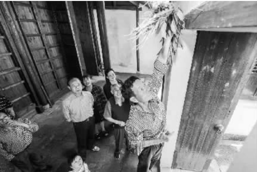
太湖古村迎端午 6 月 5 日,村民们在范家老宅内挂菖蒲艾草,用传统的方式迎接端午节的到来。当日,位于太湖边的浙江湖州织里镇义皋村的村民们在范家老宅内一起挂菖蒲艾草、包粽子,用传统的方式迎接即将到来的端午节,同时也让村民们重温乡村老宅院的传统生活。

据新华社北京 6 月 5 日电 (记者 徐博)国家安监总局 5 日发布消息称,针对广元“6·4”游船翻船事故,将迅即组成现场工作组赴事故现场,指导地方全力做好事故救援处置等工作。 安监总局称,6 月 4 日,四川省广元市轮船公司“双龙号”游船从利州区三堆镇盐井溪码头出发,前往白龙湖小三峡景区游玩,在返回途经三堆镇飞凤村 3 组时,突遇强烈阵风发生翻覆沉没。经初步核实,事故游船核载 40 人,实载 18 人,其中 4 人获救(1 人抢救无效死亡、3 人已脱离生命危险)、14 人下落不明,搜救工作正在紧张进行。 安监总局要求四川省安监局配合有关部门协助地方千方百计搜救落水人员,做好伤员救治工作,进一步核清事故情况,查明事故原因,依法依规严肃处理。 同时,要求四川省深刻汲取事故教训,举一反三,采取有力措施,深入开展水上交通安全专项整治,加强安全警示教育,切实强化对景区游船的安全监管,严格落实安全责任和措施,加大隐患排查治理力度,有效防范遏制重特大事故发生。