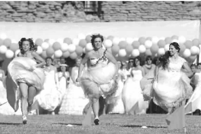
爱沙尼亚举办“国际新娘赛跑” 6 月 4 日,爱沙尼亚第三大城市纳尔瓦举行“国际新娘赛跑”,来自爱沙尼亚、俄罗斯和拉脱维亚的约 70 名女子装扮成新娘,进行 50 米赛跑,争夺钻戒大奖。

新华社新德里 6 月 5 日电 (记者 吴强)印度西部马哈拉施特拉邦 5 日发生重大交通事故,造成至少 17 人死亡、21 人受伤。 印度警方说,事故发生在金融中心孟买连接高新技术城蒲纳之间的高速公路潘维尔路段。当天凌晨 4 时左右,一辆载客大巴撞上了停在路边处理爆