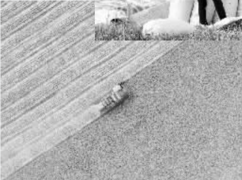
左图:6月3日,在周口市西华县的河南省黄泛区农场第十六分公司内,一台联合收割机在麦田里作业。