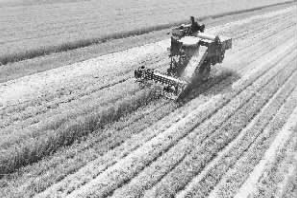
河北:夏粮丰收在望

吊销营业执照等。对于被列入清理范围的企业,在核实情况的基础上,分类规范处理:对于通过登记的住所或经营场所能够取得联系的企业,要督促其及时履行法定义务;清理对象存在已办理清算备案或已进入破产程序等情形的,可以从清理范围中剔除;对于长期未开展经营活动、经现场检查在其登记的住所或经营场所无法取得联系,且连续两年未报税的公司,工商部门依据公司法规定依法吊销其营业执照。属于“三证合一、一照一码”改革前设立的企业,税务部门可以依据《税收征收管理法》依法提请工商部门吊销其营业执照。