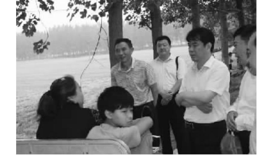
近日,沈丘县检察院积极开展精准扶贫工作,积极向群众宣传国家扶贫惠农政策,指导农民适时调整种植结构,争取早日脱贫。图为 6 月 8 日,检察长周威一在赵德营镇程寨村调研农民种植收入状况。

专题党课结束后,干警们认为,这堂党课内容丰富、生动具体,紧密联系思想实际,具有很强的教育意义和启发性。大家表示,今后要认真审视自己在理想信念和组织意识等方面存在的问题,加强思想道德修养,以一流的业绩和良好的检察形象提升司法公信力,努力让群众在每一件案件中感受到公平正义,切实增强群众的司法获得感。