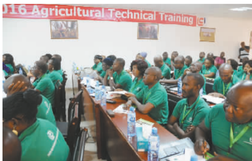
中国首次在尼日利亚举办农业技术培训 6月13日,在尼日利亚阿布贾,尼方农业技术人员聆听中国农业专家授课。这是中国首次在尼日利亚举办援外农业培训班。培训为期5天,中方为尼方40名学员提供土壤肥、种子、水稻栽培、农机实践等相关课程。 新华社发

第九届巴黎中国曲艺节由中国曲艺家协会、巴黎中国文化中心、法国《欧洲时报》与法国华商会共同举办,14日还将举办一场面向华侨华人和在法中国留学生的专场演出。