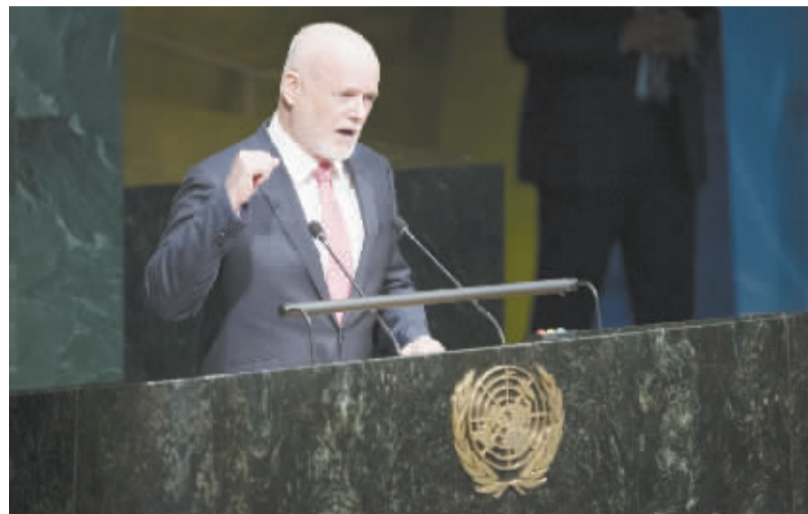
斐济外交官汤姆森当选第71届联合国大会主席 6月13日,第70届联合国大会正式选举斐济常驻联合国代表彼得·汤姆森为第71届联合国大会主席。汤姆森将于今年9月新一届大会开幕式上任。 新华社发

从2014年开始,中国已连续两年成为迪拜最大贸易伙伴,去年中迪双边贸易额为1760亿迪拉姆(约合482亿美元)。