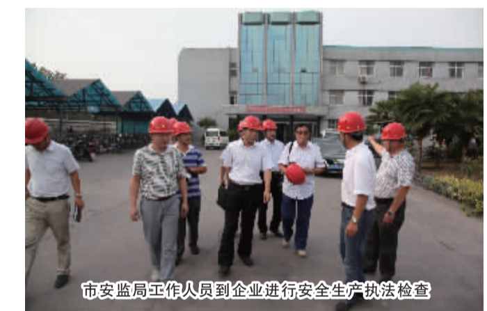
市安监局工作人员到企业进行安全生产执法检查