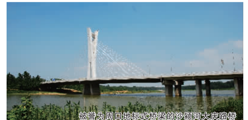
被誉为周口地标式桥梁的沙河河大庆路桥