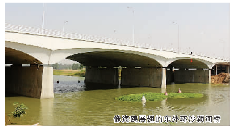
像海鸥展翅的东外环沙河河桥