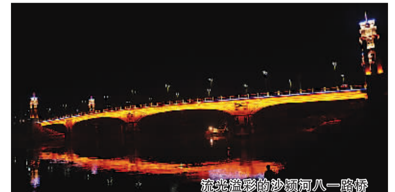
流光溢彩的沙河河八一路桥