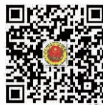
安全周口 微信公众号