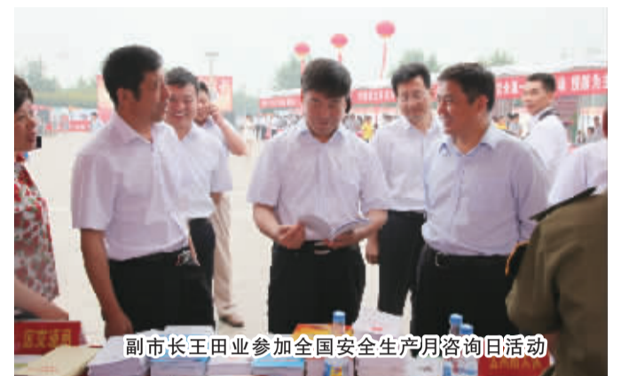
副市长王田业参加全国安全生产月咨询日活动