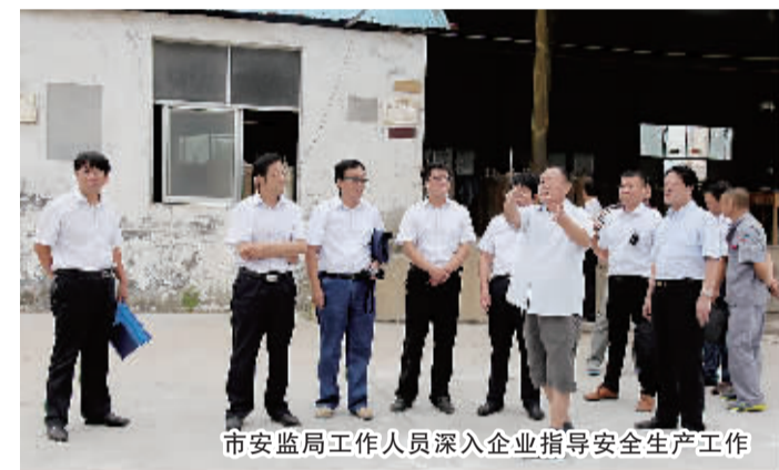
市安监局工作人员深入企业指导安全生产工作