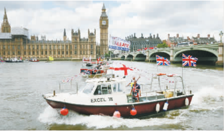
英国“留欧派”和“脱欧派”在伦敦举行造势活动 6月15日,在英国首都伦敦泰晤士河上,“脱欧派”渔船队参加造势活动。当日,英国“留欧派”和“脱欧派”在伦敦泰晤士河举行造势活动。英国将于6月23日就是否留在欧盟举行全民公决,目前“留欧派”和“脱欧派”势均力敌。 新华社发

害冲绳女子被捕。日本政府称,组建“冲绳地区安全巡逻队”旨在防范此类事件重演。冲绳和北方领土事务担当大臣岛尻安伊子对媒体说,受驻日美军恶性事件影响,冲绳县居民感到强烈不安,巡逻有助于保障居民安全。 多年来,日美两国政府一再表示将出台措施杜绝驻日美军犯罪。但受日美地位协定的庇护,驻日美军享有优先司法管辖权,犯罪后大多能躲过日本的法律追究,问题因此难以根治。日本冲绳县民众对此感到强烈不满,近年来经常在当地举行大规模集会和抗议,要求美军离开冲绳、彻底修改日美地位协定等。