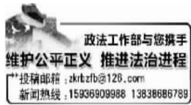
政法工作部与您携手 维护公平正义 推进法治进程

投稿邮箱:zkrrb@126.com 新闻热线:15936909988 13838686789