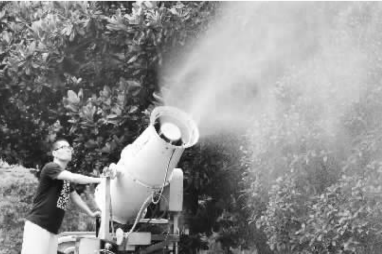
左图:近日,扶沟县组织防治专业队,进行县乡林网生物病虫害防治。