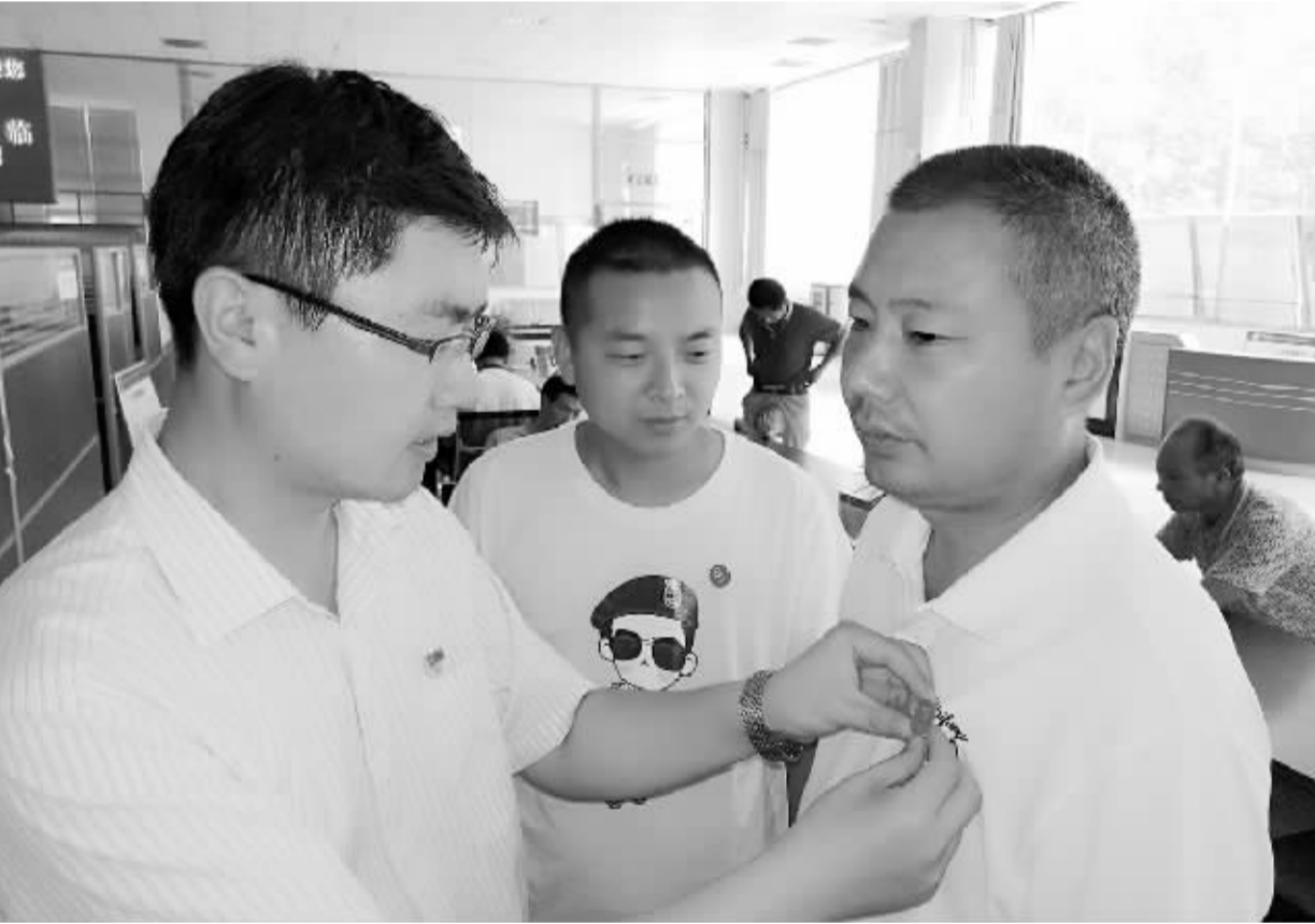
上图:为增强党员的党性意识,充分发挥党员的先锋模范作用,淮阳县王店乡党委结合“两学一做”学习教育,为全体党员干部统一配发了党徽胸章,要求每名党员在工作期间统一佩戴党徽,以表明党员身份,规范言行举止,始终牢记发挥“一名共产党员就是一面旗帜”的作用,不断提高责任意识、党员意识、自律意识、表率意识,自觉接受广大群众的监督。