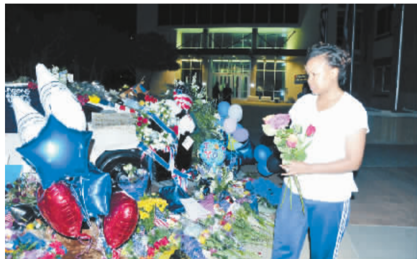
民众悼念达拉斯遇害警察 7月9日,在美国得克萨斯州达拉斯的警察局总部外,一名女子悼念遇害警察。7月7日晚,达拉斯民众在市中心举行游行抗议美国路易斯安那州及明尼苏达州警察枪杀非洲裔美国人事件时,执勤的警察突然遭到枪手开枪袭击,造成5名警察死亡。

备受关注的英国“脱欧”公投上月24日尘埃落定,主张“脱欧”一方以51.89%的支持率赢得公投。此后,一些英国人举行集会抗议“脱欧”,并发起请愿活动,呼吁举行第二次全民公投。