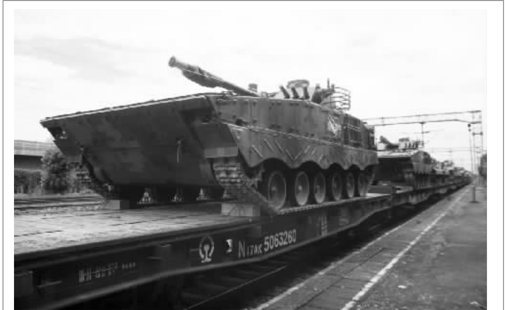
陆军“跨越-2016·朱日和”系列演习即将拉开战幕 东部战区第1集团军某装甲旅采取铁路运输、摩托化机动方式，完成战备等级转换和远程投送。来自5个战区陆军的5支陆军合成旅将参加“跨越”朱日和系列演习。按照抽签顺序，各参演部队将于7月至9月底，先后到来日和基地与我军首支陆军专业化模拟蓝军队展开实兵对抗。 新华社发

拉 动 召之即来的网约车司机、送服务上门的网约按摩师、专做网络订餐的餐饮从业者……这些伴随“互联网+”应运而生的新兴职业，逐渐走进大众视野，成为许多人的择业选择，也成为我国劳动力市场不可忽视的新生力量。就业关系经济社会发展大局，也是改善民生的基础所在。解决就业问题的根本在于发展和创新。 新华社发