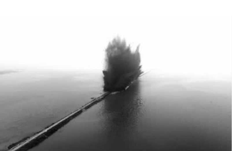
湖北省梁子湖流域的牛山湖正式破垸分洪 7月14日，梁子湖与牛山湖隔堤在实施爆破作业。据湖北水利专家论证，破垸分洪后，两湖变一湖，面积将达到370多平方公里，原来的牛山湖可以承担梁子湖5000万立方米水量。

河南省相关部门日前明确把“扶持创业带动”作为渠道之一。通过对贫困地区开展创业培训、创业服务、创业担保贷款等方面的扶持，期望以创业带动更多人就业脱贫。