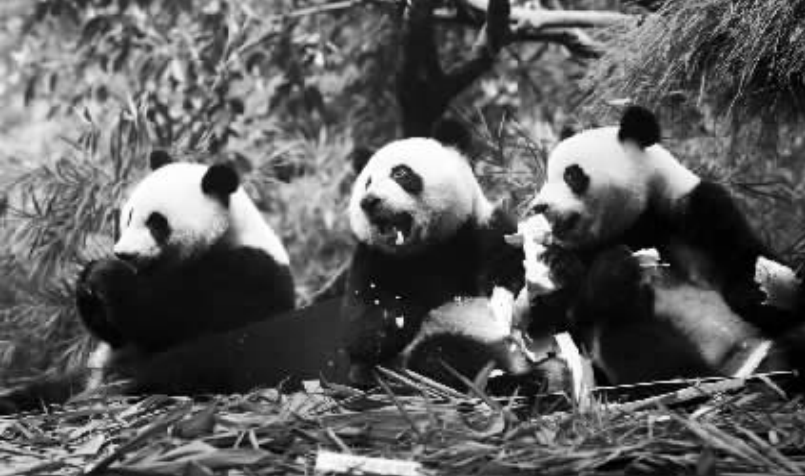
全球唯一存活大熊猫三胞胎断奶 7月14日，大熊猫三胞胎萌萌、帅帅、酷酷在吃竹笋。全球唯一存活大熊猫三胞胎自2014年7月29日在广州长隆诞生以来，在动物保护专家团队共同努力下，相继顺利度过开眼、百日、学会走路等重要生命节点。

根据意见，各级法院要按照“执行到位、有效化解”的原则办理执行实施类信访案件。如果被执行入具有可供执行财产，应当穷尽各类执行措施，尽快执行到位；如果被执行入确无财产可供执行，应当尽最大努力解释说明，争取息诉罢访，有效化解信访矛盾。