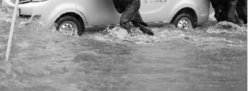
华北多地迎强降雨天气 7月19日，交警在山西运城街头救援抛锚车辆。当日，我国华北地区多地遭遇强降雨天气，部分城市内涝严重。

根据学术委员会的认定结论和处理建议，高等学校应当结合行为性质和情节轻重，依职权和规定程序对学术不端行为责任人作出处理。经调查不构成学术不端行为的，高等学校应通过一定方式为其消除影响、恢复名誉等。为了保护当事人的权益，《办法》还专门规定了异议与复核等程序，努力通过程序保障机制确保“勿枉勿纵”。