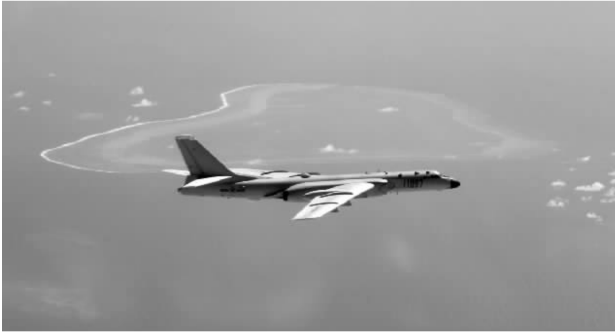
近日，空军轰-6K飞机在黄岩岛等岛礁附近空域巡航。

空军新闻发言人指出，南海诸岛自古以来就是中国领土，中国在南海的主权和权益不容侵犯。中国空军坚定不移捍卫国家主权、安全和海洋权益，坚决维护地区和平稳定，应对各种威胁挑战。