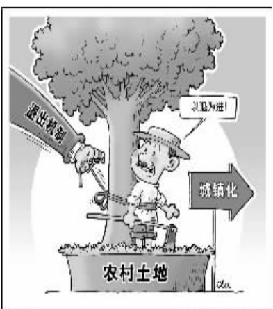
“城镇化” 张景华 画