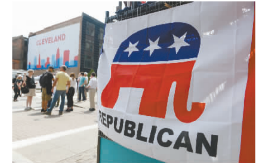
美国共和党大会开幕 克利夫兰加强安保 7 月 18 日，在美国俄亥俄州克利夫兰，人们参加共和党全国代表大会。 美国共和党 2016 年全国代表大会于 18 日至 21 日在俄亥俄州克利夫兰举行，期间有超过 5 万人涌入克利夫兰及周边地区，给共和党代表大会的安保带来挑战。据当地媒体报道，警方从全国各地调配 5000 余名警察，以加强克利夫兰的安保工作。

新华社首尔 7 月 19 日电 韩国联合参谋本部 19 日称，朝鲜当天早晨向朝鲜半岛东部海域发射 3 枚弹道导弹。 韩联社援引韩国联合参谋本部的消息报道说，朝鲜于当天 5 时 45 分至 6 时 40 分许，先后从黄海北道黄州一带向朝鲜半岛东部海域发射 3 枚弹道导弹。导弹飞行距离约为 500 至 600 公里。 报道说，据推测朝鲜此次发射的可能 是“飞毛腿”C 型弹道导弹。有分析认为，这是朝鲜对韩国此前宣布在星州部