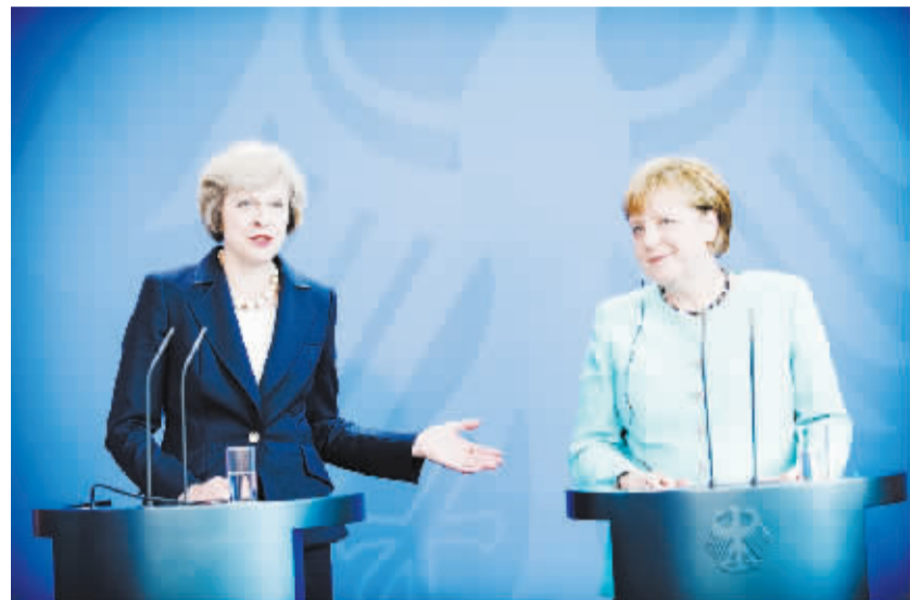
英国首相特雷莎·梅访问德国 7月20日,在德国柏林,德国总理默克尔(右)与英国首相特雷莎·梅出席新闻发布会。当日,英国新任首相特雷莎·梅到访德国首都柏林,并同德国总理默克尔举行了会晤。

与此同时,2016年6月赴海外旅行的新西兰居民达23.94万人次,比去年同期增长6%。最受新西兰人欢迎的旅行目的地是澳大利亚、中国和库克群岛。