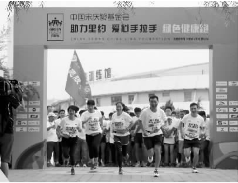
“助力里约 爱心手拉手”绿色健康跑活动在京举行 7 月 24 日,选手们在活动中出发。当日,由中国宋庆龄基金会主办的“助力里约 爱心手拉手”绿色健康跑活动在北京奥体中心举行。

此次督查,政府主导,部门主办,监察主核,运用“明察+暗访”结合的方法,真正做到见人、见账、见物、见资金。米剑峰说,对于逾期完不成整改任务的督查事项,全部转为拟问责事项,启动问责程序;对于逾期仍无动于衷的问责事项,立即予以追责;对于工作态度好、进展速度快的拟问责事项,可转为督查事项,予以跟踪督查。