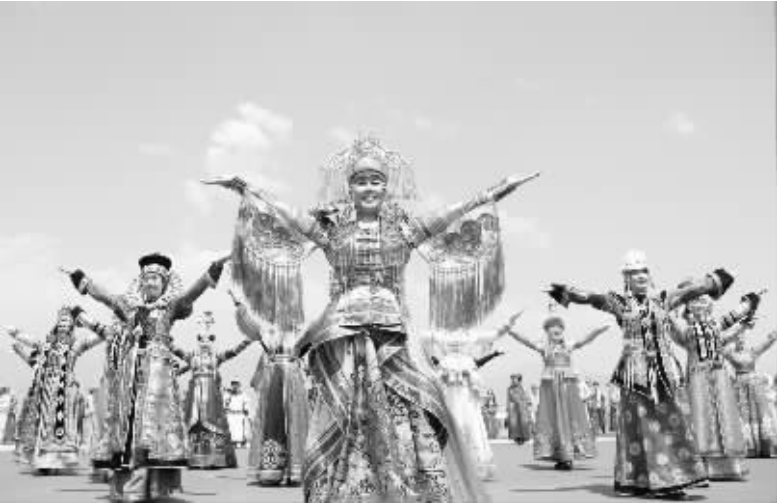
内蒙古第二十七届草原旅游那达慕大会开幕 7 月 23 日,模特展示蒙古族传统服饰。当日,内蒙古第二十七届草原旅游那达慕大会暨第十三届中国·蒙古族服装服饰艺术节在呼和浩特市开幕。本次那达慕大会为期 7 天,期间将举办射箭、赛马、搏克等传统体育活