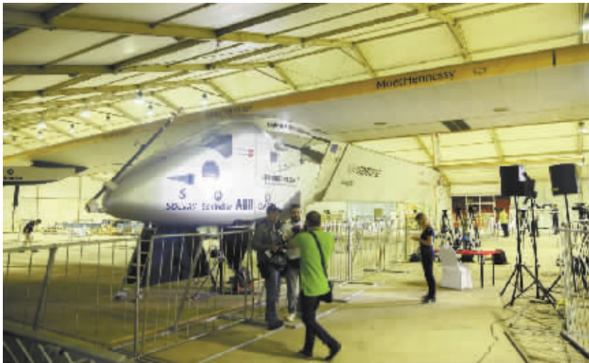
全球最大太阳能飞机环球之旅达成在望 这是 7 月 23 日在埃及开罗国际机场拍摄的全球最大太阳能飞机“阳光动力”2 号。当日,“阳光动力”2 号结束在埃及及开罗的停留,启程飞往环球之旅的终点站——阿联酋首都阿布扎比。

取得了卓越成就,东盟已被世界认可为一个成功的地区政府间组织。 通伦说,作为东盟轮值主席国,老挝今年有 8 项优先工作任务:落实《东盟共同体愿景 2025》,缩小地区发展差距,促进贸易便利化,促进中小企业发展,推广东盟旅游,加强东盟互联互通,在东盟内部推动劳动力体面就业及加强文化遗产合作。 通伦表示,本届东盟外长会议及相关会议为与会各方提供了良好机会,以讨论如何进一步推动落实《东盟共同体愿景 2025》,并在东盟为主的机制下,更好地加强东盟与对话伙伴之间的合作。