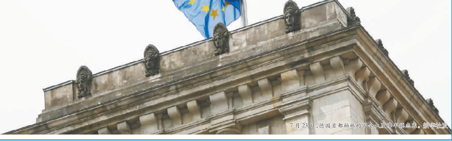
7 月 23 日,德国首都柏林的国会大厦前举行集会。

作为北约成员国,德国正寻求扩大军事影响力。德国国防部日前正式发布十年来首部国防白皮书,重新定义德国安全利益,强调德国未来将承担更多国际责任,在国际军事事务中发挥更强领导作用,增加国防支出,并在北约框架下参与更多行动。 有分析指出,在北约行动中增加“存在感”可能令德国引火烧身并成为恐怖势力袭击的重要目标。 另一个结构性问题在于如何帮助难民融入德国社会,尤其是年轻难民。维尔茨堡火车袭击案和慕尼黑枪击案的袭击者均为不到 20 岁的年轻人。年轻人具有易冲动、易被煽动、蛊惑等特点,这使得年轻难民的融入问题更加棘手。 有德国媒体针对维尔茨堡火车袭击案指出,一名 17 岁的难民在德国生活一年多时间,没有融入德国社会却被“伊斯兰国”洗脑,这值得深思。 随着安全形势趋于严峻,德国收紧难民政策的可能性正在加大。基社盟主席、巴伐利亚州州长泽霍费尔要求对难民加强管控,必须确保难民与“伊斯兰国”之间没有联系。这意味着默克尔领导的联盟党(由基民盟和基社盟组成)将在难民问题上面临更多压力。 (新华社法兰克福 7 月 24 日电)