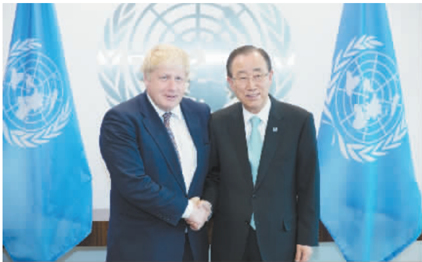
英国外交大臣说英国不会因“脱欧”而变得孤立 7 月 22 日,在位于美国纽约的联合国总部,英国外交大臣鲍里斯·约翰逊(左)与联合国秘书长潘基文握手。英国外交大臣鲍里斯·约翰逊 22 日在联合国总部说,英国不会因“脱欧”而变得孤立,会努力在国际事务中发挥更大作用。

近期,极端组织“伊斯兰国”在巴格达及伊拉克其他城市频频实施袭击,导致大量人员伤亡。7 月 3 日,“伊斯兰国”武装人员在巴格达卡拉达区实施自杀式爆炸袭击,造成 292 人死亡、200 人受伤。 据联合国伊拉克援助团统计,今年 6 月,伊拉克境内发生的暴力冲突和恐怖袭击造成至少 662 人死亡、1457 人受伤。