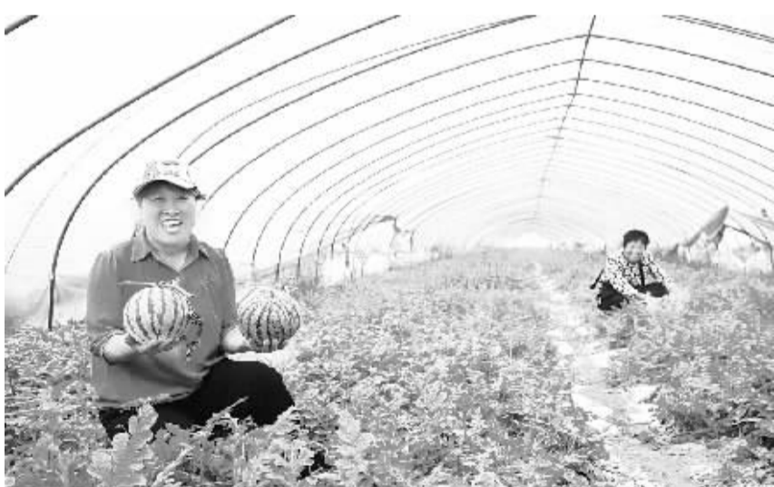
昨日,项城市天禾开心农场瓜农正在采摘西瓜。这个农场是该市润禾种植合作社的一个分社,返租土地120多亩,建西瓜大棚50多个,每亩可获利1万多元。据悉,项城市以农村专业合作社为龙头,大力发展特色农业,带动了农民脱贫致富。