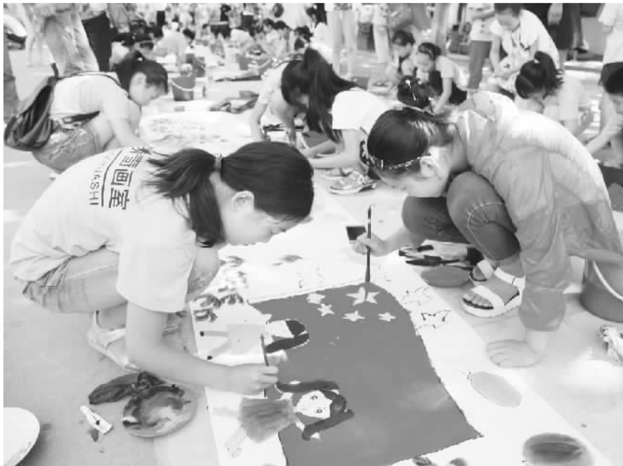
近日,项城市举行了“践行社会主义核心价值观书画创作”活动,100多位少年儿童参加了活动。这次活动旨在引领孩子们在艺术创作和欣赏的过程中,感受书画背后的精神内涵,努力把社会主义核心价值观内化于心、外化于行,着力凝聚实现中国梦的时代正能量。图为活动现场。

该办事处实行物业公司卫生保洁后,达到了白天与黑夜、晴天与雨天、假期与平时、检查与不检查“四个一样”。办事处的美丽乡村经费支出也由平均每月3.6万元降至2.4万元,每月减少支出1万多元。