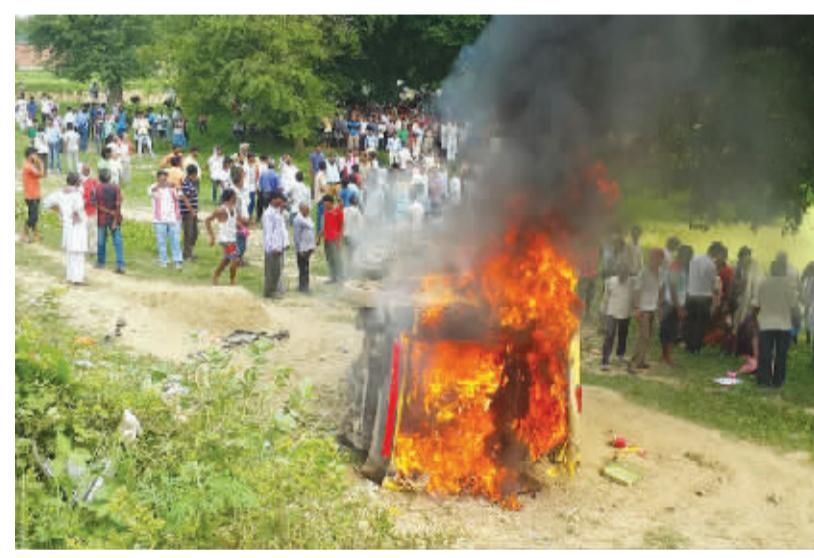
印度发生火车与校车相撞事故 这是7月25日在印度北方邦珀多希的事故现场拍摄的着火的校车。据一名当地警方官员说,一辆校车与一列疾驰的火车25日早晨在珀多希的一个无人监控道口相撞,造成至少7名儿童死亡,12名儿童受伤。

新华社大马士革7月25日电(记者 车宏亮)叙利亚首都大马士革25日再遭多轮迫击炮袭击,并伴有汽车炸弹袭击,造成多人死伤。 据叙利亚通讯社报道,大马士革多个居民区遭迫击炮袭击,造成一名平民死亡,另有9人受伤。大马士革西部一所学校附近