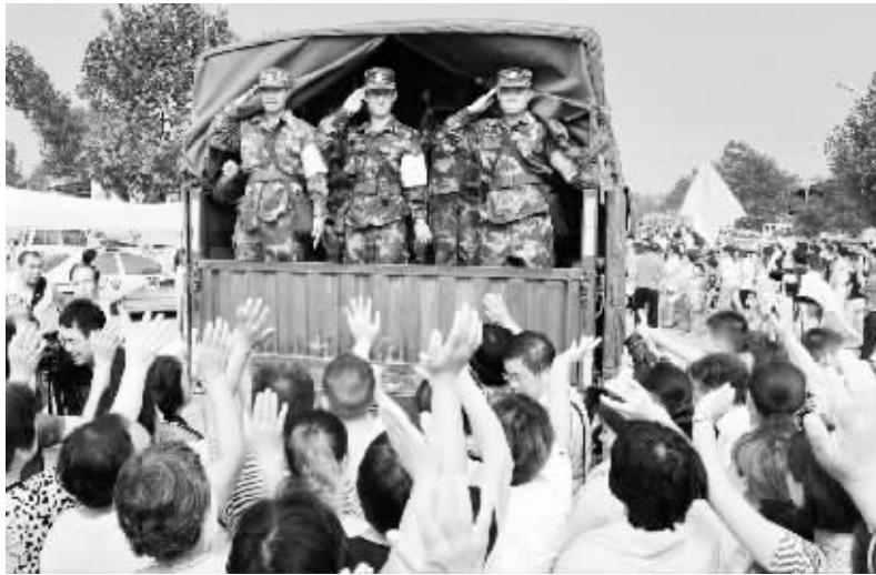
惜别抗洪子弟兵 8月4日，启程返回驻地的武警部队官兵向前来送别的群众敬礼。当日，随着抗洪抢险救援作业主体完工，驰援河北省邢台市洪涝灾区的武警水电部队官兵启程返回驻地。当地干部群众夹道送别抗洪子弟兵。 新华社发