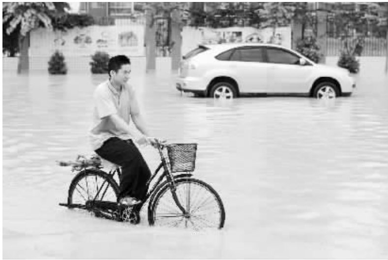
“妮姐”余威影响广西 8月4日，市民在被积水淹没的南宁市安国东路骑行。台风“妮姐”已经远去，但残留低压环流仍给广西带来影响，广西多地遭遇暴雨袭击。

海南省规定，在试点工作过程中，因借款人未履行到期债务或者发生当事人约定的情形需要实现抵押权时，允许金融机构在保证农户土地承包权和基本住房权利前提下，依法采取多种方式处置抵押物。