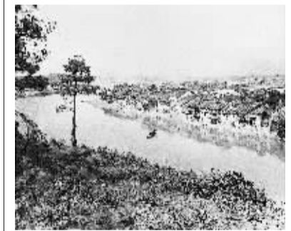
湘江战役遗址——广西兴安界首渡口(资料照片)。新华社发