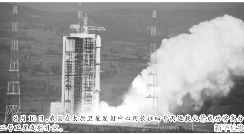
8月10日,我国在太原卫星发射中心用长征四号丙运载火箭成功将高分三号卫星发射升空。

新华社太原8月10日电(于晓泉 路俊 杨维汉)北京时间10日6时55分,我国在太原卫星发射中心用长征四号丙运载火箭成功将高分三号卫星发射升空。这是我国首颗分辨率达到1米的C频段多极化合成孔径雷达(SAR)成像卫星。