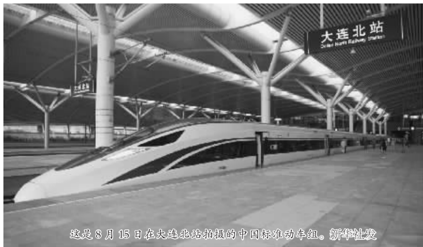
这是8月15日在大连北站拍摄的中国标准动车组。

据介绍,现阶段的载客运行将在实际运营条件下,进一步积累乘客对旅客界面和客服设施的实际感受,提高后续批量产品服务品质,提升旅客乘车体验。