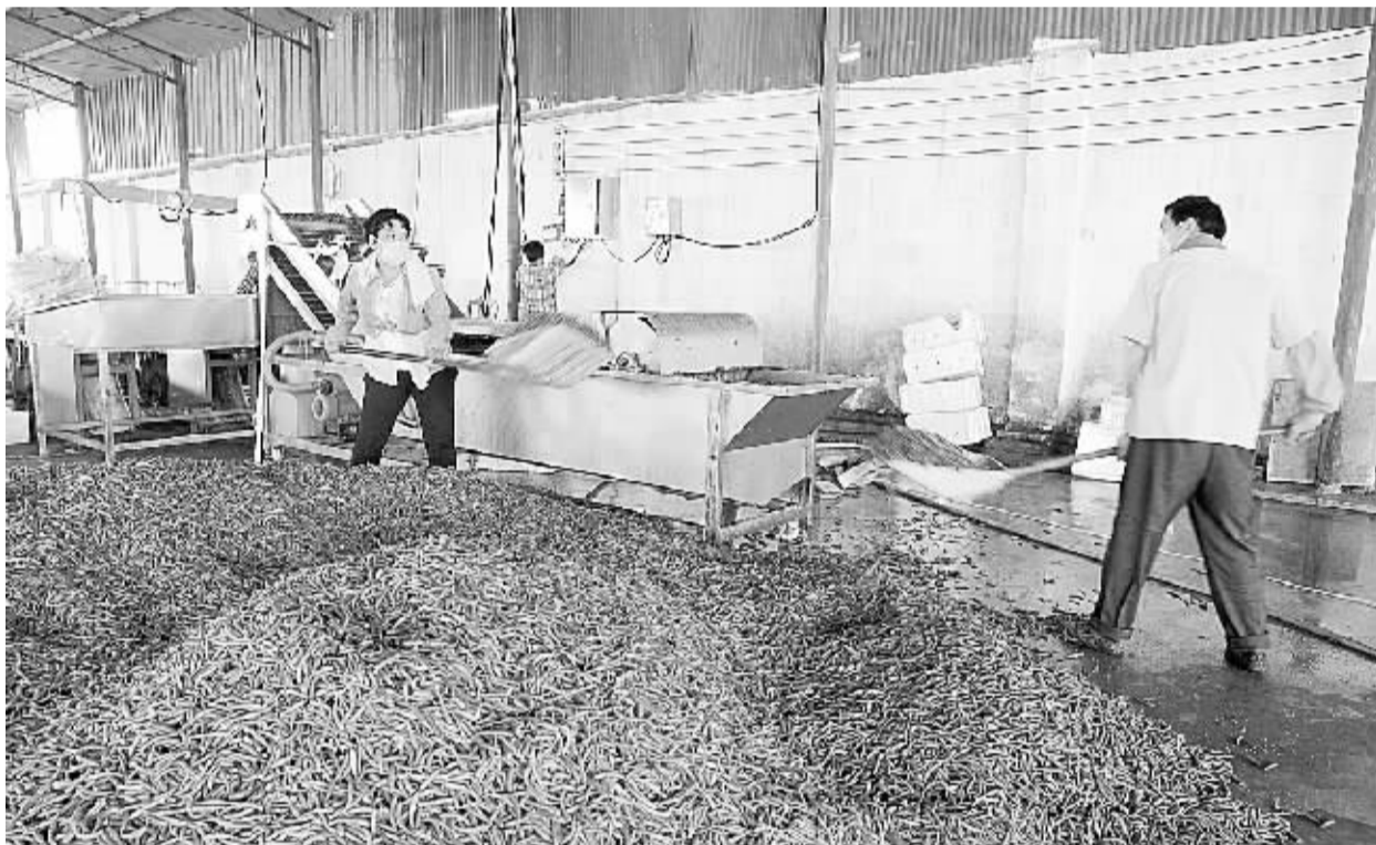
位于郸城县胡集乡的鸿雁农产品专业合作社拥有保鲜库一座、生产线一条,可日加工鲜辣椒20万斤。他们吸收贫困户60余人在公司上班,同时保证优先安排有劳动能力的贫困户在公司务工,带动了贫困户脱贫致富。

各省、自治区、直辖市和计划单列市、新疆生产建设兵团,中央和国家机关有关部门、有关人民团体,中央军委有关部门,武警部队负责同志和专家学者代表等参加会议。