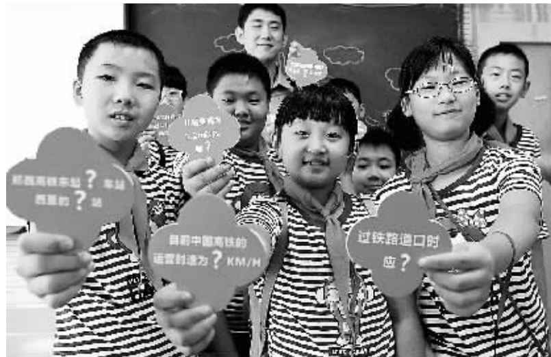
开学第一课 安全陪伴我 8月29日，河南省三门峡市外国语小学的学生们展示铁路安全知识卡。新学期伊始，郑州铁路局洛阳车务段的工作人员来到河南省三门峡市外国语小学，开展“金秋第一课·安全陪伴我”铁路安全知识讲座，让学生们了解、掌握铁路安全知识，增强“知路、爱路、护路”意识。

银行理财已成为银行业的重要业务，是居民增加财产性收入的重要渠道。截至6月末，全国共有600多家银行业金融机构开展了理财业务，存量规模超过26万亿元。