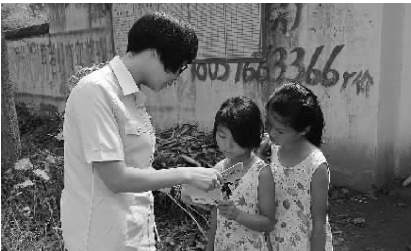
8月10日，沈丘县法院干警到北杨集乡谷林庄行政村，为5名留守儿童送去文具等物品，帮助孩子实现“微心愿”。

杜某一家人心病解除了，特意赶制一面绣着“爱民民警为民分忧”的锦旗送至该所，表达感激之情。