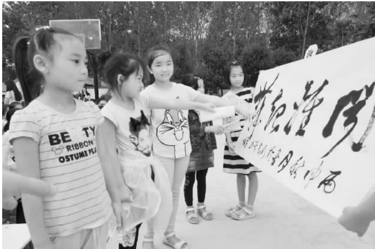
日前,项城市各中小学校已经开学。该市组织书法家走进校园,开展“送书法进校园”活动,培养学生学习书法的兴趣,促进广大师生对书法艺术的认识和理解。图为孩子们正在欣赏书法作品。

孝老爱亲、家庭和睦是社会和谐的基础。邓城镇开展“最美家庭、好婆婆、好媳妇”评选活动,目的就是要用榜样的力量激励和带动全镇,示范带动更多的家庭自觉践行社会主义核心价值观,提升社会公德、家庭美德和个人品德,从而营造尊老爱幼、家庭和美、邻里和睦的良好风尚。