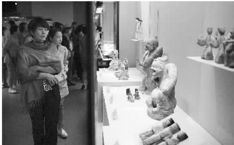
首届丝绸之路(敦煌)国际文化博览会文化年开展开始预展 9月12日,观众在首届丝绸之路(敦煌)国际文化博览会文化年展上参观精品文物。据介绍,本次文化年展总展览面积3.6万平方米,展品涵盖历史文物、非遗保护、艺术收藏、创意设计等领域。

据统计,最近10年间(2007至2016年),中秋月亮“十五圆”有3次,“十六圆”有5次,“十七圆”有2次。天文专家表示,虽然中秋节当晚的月亮并不是最圆的,但公众肉眼无法分辨,对赏月也没有太大影响。