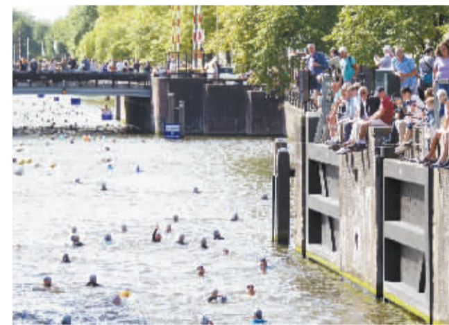
阿姆斯特丹举办游泳活动为“渐冻症”患者筹款

按路透社的说法,国际原子能机构近期这份报告中并未提及任何伊朗在履行协议期间出现的违规行为。