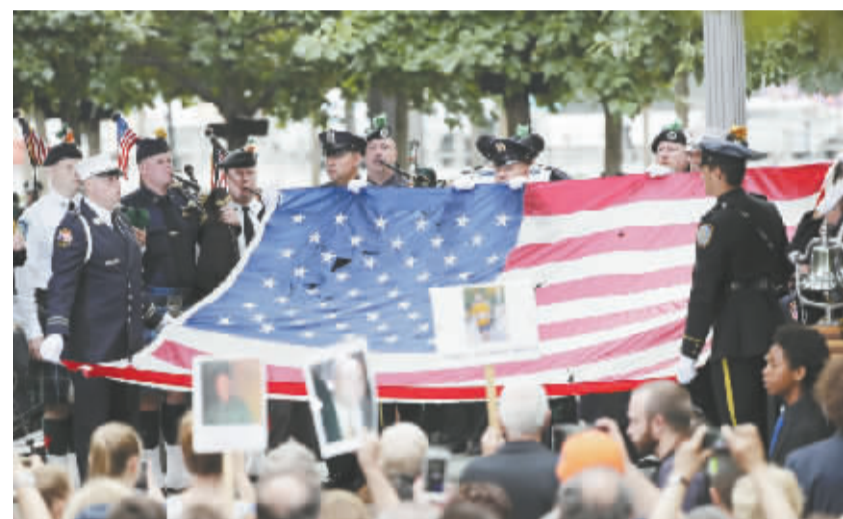
纽约举行“9·11”事件15周年纪念活动

反恐自此成为美国常态。但15年过去,美国人发现,反恐陷入僵局,漫漫未有穷期。美国更安全还是更危险,未来反恐何去何从,成为这个大选年的争议话题。