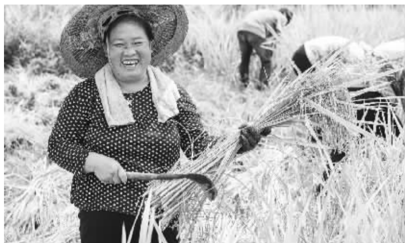
稻谷黄 秋收忙 9月19日,瓮安县岚关乡郊外,当地村民在收割水稻。近日,贵州省黔南布依族苗族自治州瓮安县郊外水稻大面积成熟,当地村民抢抓有利农时收割稻谷。

中央网信办网络安全协调局局长赵泽良说,网络安全的竞争归根到底是人才的竞争,今年的网络安全宣传周首次举办网络安全杰出人才、优秀人才、优秀教师等先进典型表彰活动,是要通过网络安全宣传周的平台建设一个爱护网络人才、培养网络人才的良好格局。