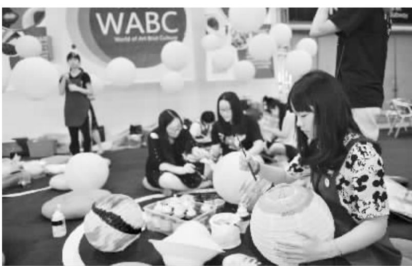
第五届中国慈善会开幕 聚焦慈善资源精准扶贫 9月23日,参与者在第五届慈善会的无障碍公益展台上为灯笼填色。当日,第五届中国公益慈善项目交流展示会(简称慈善会)在深圳开幕。

上的“彩虹鱼”项目团队在新不列颠海沟开展了多项海洋环境调查工作。目前,上海海洋大学与上海彩虹鱼海洋科技股份有限公司正联合打造我国万米级深渊科学技术流动实验室。实验室由科考母船“张謇”号和三台万米级着陆器、一台万米级无人潜水器、一台万米级载人潜水器共同组成。“张謇”号成功首航,标志着这一项目迈出了重要一步。“张謇”号经过长达两个多月、近万海里的风浪洗礼,实际检验了船上的各项远洋航行性能和各种科考设备的可靠性。在首航过程中,“张謇”号一路遭遇了“妮妲”“莫兰蒂”“马勒卡”等多个台风的“围追堵截”,还遇到了南太平洋新爱尔兰地震,收到海啸预警。在“张謇”号首任船长查达武的带领下,全体船员团结一心、沉着应对,在各种复杂的海况下,确保了船舶航行和作业安全。