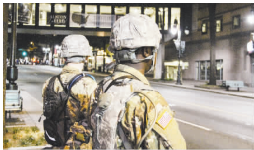
民众抗议进入第三天 美国夏洛特市宣布宵禁 9月22日,在美国北卡罗来纳州夏洛特市,安全人员在抗议现场执勤。美国北卡罗来纳州夏洛特市22日晚连续第三天爆发民众抗议警察枪杀无辜黑人的活动,市长珍妮弗·罗伯茨宣布在该市实行宵禁,以防暴力活动继续蔓延。

俄军方没有具体说明该航母此次出发的地点、执行任务的起止时间、携带战机的具体数量以及执行何种任务,但据俄新社报道,该航母此次出征是应叙利亚政府的要求,其主要行动是以舰载机增援叙利亚叙利亚塔基亚空军基地的空军,以加强打击叙境内恐怖分子的力量。 另据俄罗斯摩尔曼斯克“TV-21”电视台报道,该舰将在今年10月至明年1月期间执行任务。