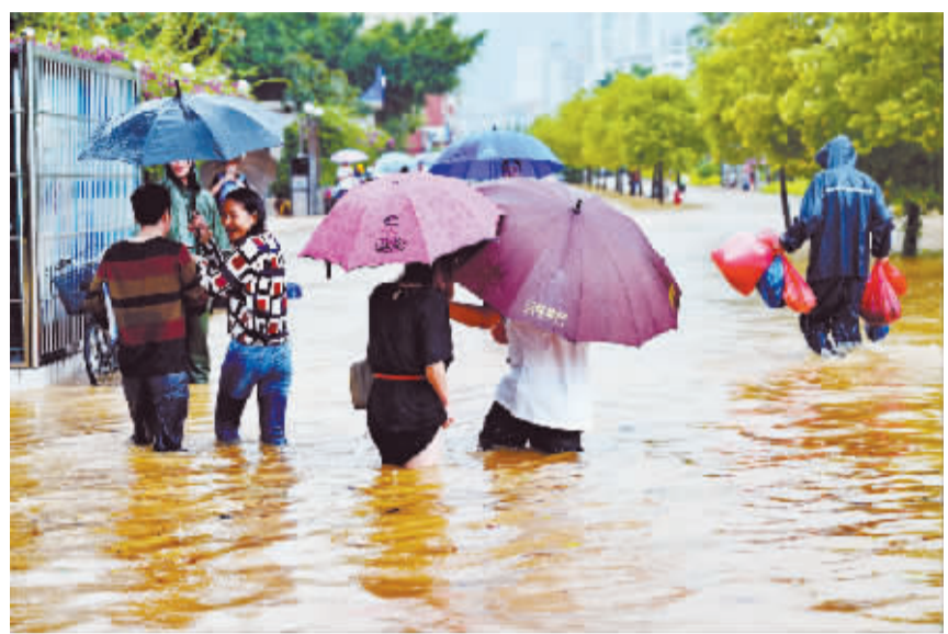
台风“鲇鱼”登陆福建 中央气象台发布双橙色预警 9月28日,市民在福建省宁德市区街头涉水通过。当日,今年第17号台风“鲇鱼”4时40分在福建省惠安沿海登陆。中央气象台6时发布台风橙色预警和暴雨橙色预警,提醒相关地区和部门做好防风防汛应急工作。

徐成光说,保障群众安全出行是交通运输工作的重中之重。为做好运输保障,“十一”黄金周期间,全国将投入83万余辆营运客车、约2150万个客位;2万余艘客运船舶,100余万个客位参与道路、水路运输。此外,在旅游景区等需求旺盛地区将增加班车、包车,旅游客车运力投入,对运输量较大的水上航线合理安排运力和班次,做好应急运力准备。