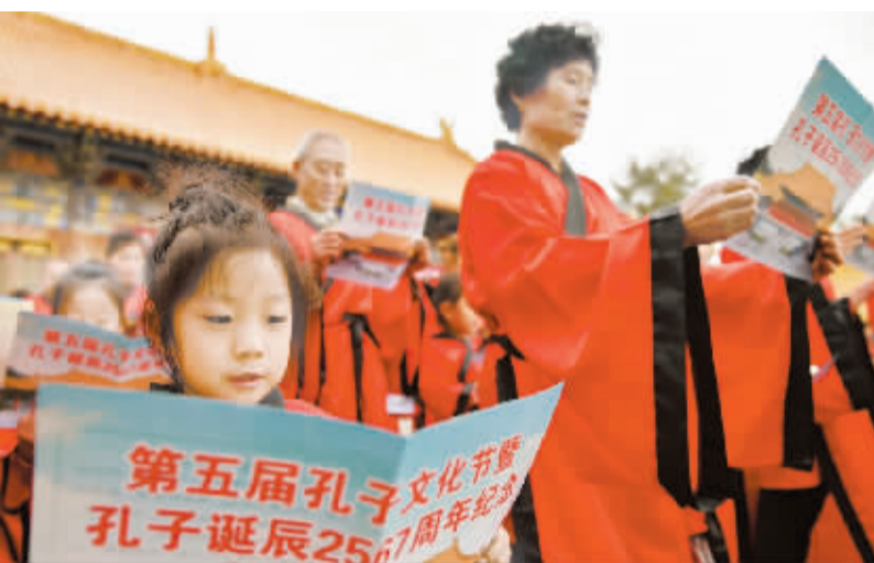
9月28日,参加济南府学文庙祭孔活动的市民在诵读祭文。当日,各地纷纷举办祭孔活动,纪念先贤孔子诞辰2567年。