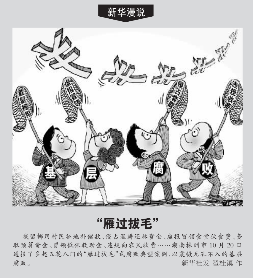
截留挪用村民征地补偿款，侵占退耕还林资金、虚报冒领食堂伙食费、套取预算资金、冒领低保救助金、违规向农民收费……湖南株洲市 10 月 20 日通报了多起五花八门的“雁过拔毛”式腐败典型案例，以震慑无孔不入的基层腐败。

河南省中大拍卖有限公司 监督电话：0394-8394038 2016 年 10 月 21 日