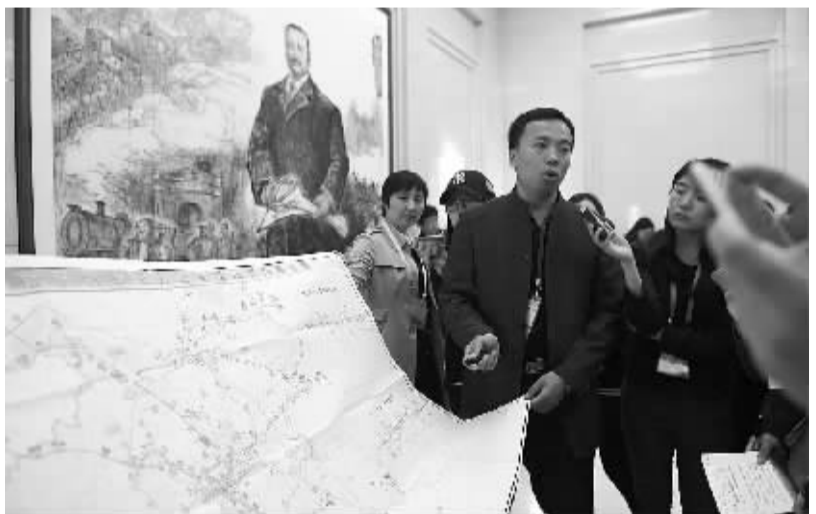
北京北站11月1日起暂停客运业务 清华园站关停 10月25日,工作人员介绍张铁路引入北京铁路枢纽方案示意图。记者从北京铁路局了解到,为配合京(北京)张(张家口)高铁北京北至清河段引入北京铁路枢纽工程施工,自11月1日起,北京北站、清河站暂停办理客运业务,“百年老站”清华园站则彻底停止办理客运业务。 新华社发

据广东省民政厅报告,汕头、惠州、梅州等7市38个县(市、区)186.5万人受灾,9.5万人紧急转移安置,6.2万人需紧急生活救助;近600间房屋倒塌,3100余间不同程度损坏;农作物受灾面积210.2千公顷,其中绝收14.6千公顷;直接经济损失44.7亿元。