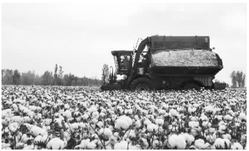
新疆塔里木盆地棉花采摘进入尾声 在新疆阿拉尔市一处棉田里,一部采棉机正在工作(10月23日摄)。随着气温日渐降低,我国最重要的棉花产地——新疆塔里木盆地棉花采摘进入尾声。预计10月底,采摘工作将基本完成。

当日,人力资源和社会保障部召开新闻发布会,通报2016年第三季度人社工作进展情况。谈及今年“国考”报名情况,李忠介绍,网上报名从10月15日开始至24日,已经正式截止。初步统计,网上报名人数211.5万人,比去年略多一些。目前通过资格审查人数是136万人。资格审查工作还须持续几天时间,人社部将在资格审查工作全部结束之后,向社会公布招考的总体情况。