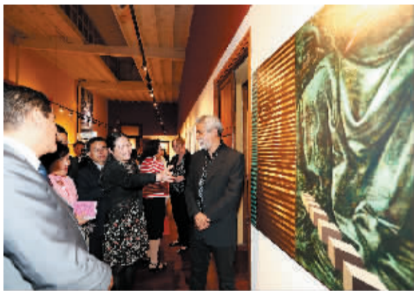
“感知中国 走进秘鲁——APEC‘人与自然’艺术展”亮相秘鲁

欧洲食品安全局的专家正在帮助成员国开展信息收集活动,以了解这种病毒是如何通过野生鸟类传染给家禽的。这些信息将有助欧洲食品安全局重新评估禽流感在欧洲传播的风险。