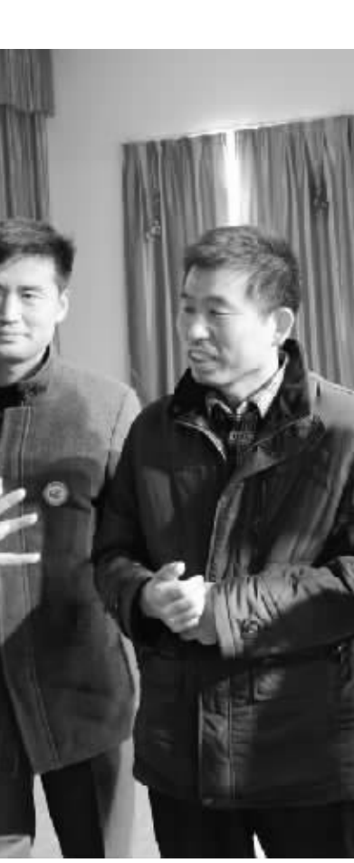
近日，我市中小学“名校长、名园长”第二次集中培训开班，期间，关于“因材施教、使老师感受到无尚荣光和责任的校本仪式，因人而异、让学生得到自主发展、生命放歌的育人理念”等充满活力、内涵丰富的教育理念开阔了学员们的视野。图为学员们向授课专家、“基础教育国家级教学成果奖”获得者林良富（左一）请教。

财政收入平稳增长。1 至 10 月，全市地方财政总收入完成 113.60 亿元，同比增长 13.6%，增收 13.63 亿元。一