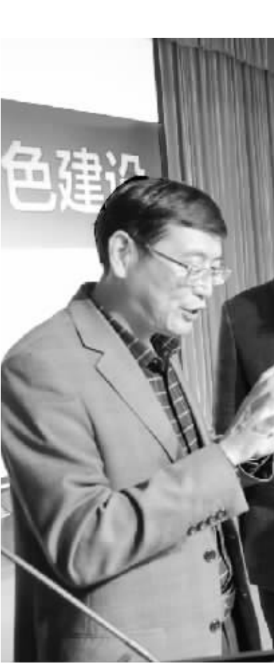
近日，我市中小学“名校长、名园长”第二次集中培训开班，期间，关于“因材施教、使老师感受到无尚荣光和责任的校本仪式，因人而异、让学生得到自主发展、生命放歌的育人理念”等充满活力、内涵丰富的教育理念开阔了学员们的视野。图为学员们向授课专家、“基础教育国家级教学成果奖”获得者林良富（左一）请教。

固定资产投资增长趋稳。1 至 10 月，全市完成固定资产投资（不含农户）1337.91 亿元，同比增长 15.4%，高于全省 2.3 个百分点。分产业看，第一产业完