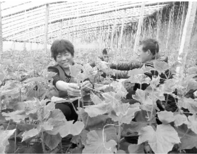
扶沟县练寺镇党委政府为帮助农民增收，引进黄瓜新品种和先进的黄瓜种植技术，成立宏源蔬菜种植专业合作社，对黄瓜实行统一种植、统一管理、统一收获、统一销售，并派一名技术员定期指导，种植出了口感脆甜的有机黄瓜，深受市场和客户欢迎。图为该镇桑村菜农正在管理黄瓜。

为认真贯彻落实省委和市委相关文件精神，积极推进全市规划系统服务型行政执法建设工作持续深入开展，表彰先进，树立典型，进一步调动全市规划系统依法行政和规划执法工作者的积极性和创造性，全面提高规划系统依法行政和规划执法水平，近日，市规划局开展了评选表彰十佳基层服务型行政执法标兵活动。一是明确评选范围和表彰名额。二是确定评选条件。三是提出具体要求。该局根据十佳基层服务型行政执法标兵的事迹材料及打印成册，发放到全市规划系统各单位，广泛进行学习宣传教育，形成学先进、赶先进的良好氛围。（何辉 李斌）