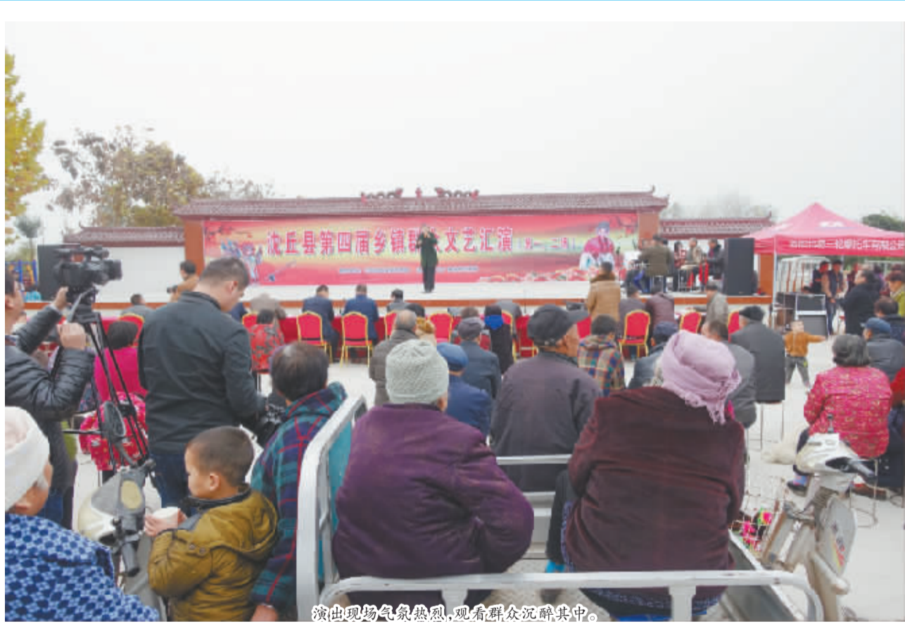
演出现场气氛热烈,观看群众沉醉其中。

打好“排查拳”。该镇深入推行社会矛盾纠纷和信访突出问题“大排查”,扎实推进“领导干部大接访”和信访积案化解工作,截至目前,积极有效排查矛盾纠纷15起,化解调处15起,确保了全镇大局和谐稳定。(梁珂琪)