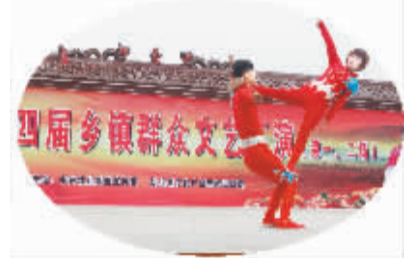
参赛选手在表演《真功夫》