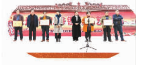
颁奖嘉宾与获奖选手合影留念。

本报讯 11月16日,由沈丘县委宣传部、县文广新局联合主办的第四届乡镇群众文艺汇演,在纸店镇卢庄行政村文化中心广场隆重举行。沈丘县委常委、宣传部部长郭宇出席开幕式,并与当地群众一起观看了汇演。此次文艺汇演共分5场,首场演出共有10个乡镇、40个节目参加。参赛节目均由各乡镇办基层文化站选送,节目包括歌曲、广场舞、器乐独奏、豫剧、曲剧、大鼓书、杂技、坠子、快板等多种艺术形式。本次汇演设一等奖1名、二等奖2名、三等奖3名,胜出的将参加年底举办的第5场汇演总决赛。