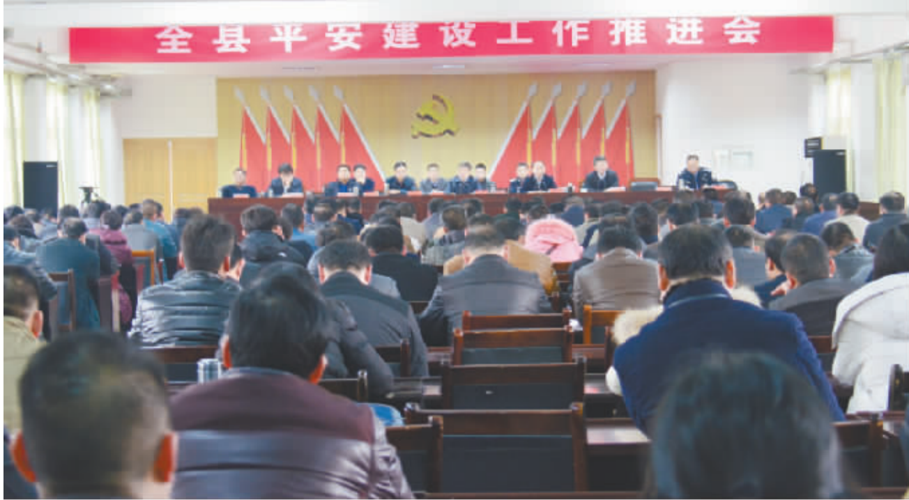
沈丘县平安建设工作推进会现场

皇甫立新要求,要突出重点、补齐短板,扭转被动局面。一要深入学习贯彻十八届六中全会和省十次党代会精神。党的十八届六中全会专题研究了全面从严治党重大问题,审议通过了《关于新形势下党内政治生活的若干准则》和《中国共产党党内监督条例》,为新形势下加强和规范党内政治生活、加强党内监督提供了根本遵循,确保党始终成为中国特色社会主义事业的坚强领导,具有重大意义。省十次党代会,规划了未来五年全省的发展蓝图,为我们做好今后各项工