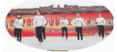
北杨集乡选送的广场舞《创造奇迹》