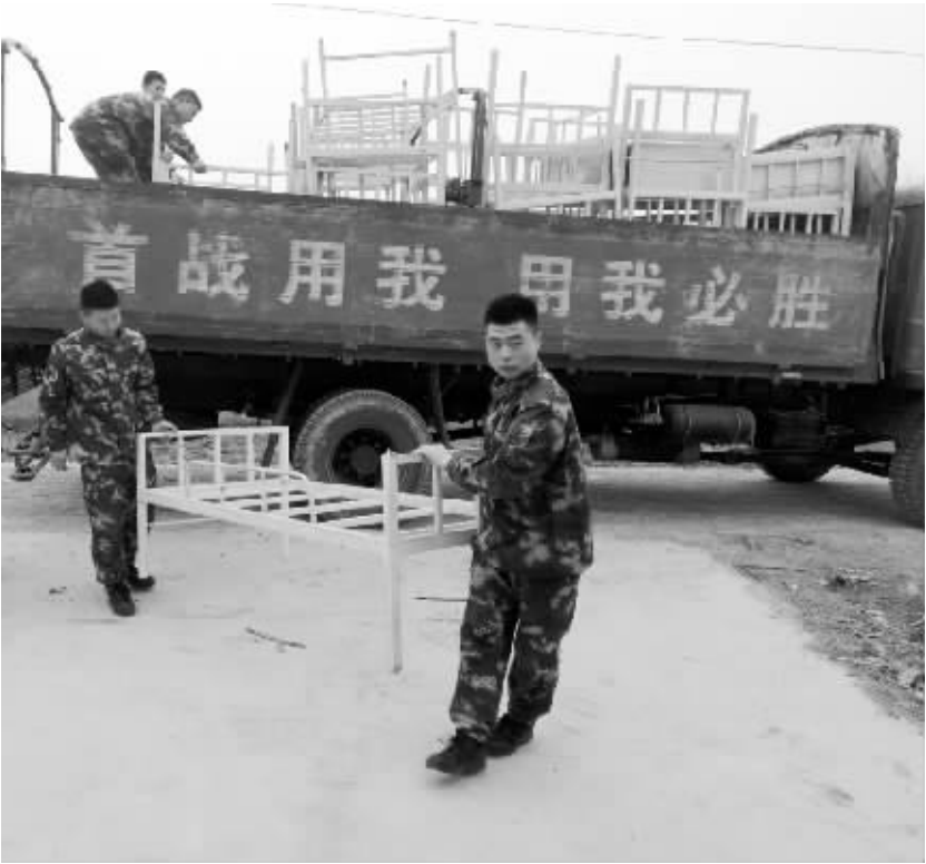
武警周口支队积极参与驻地的扶贫工作。近日，该支队官兵与周口报业集团扶贫驻村工作队为淮阳县冯塘乡刘庄村送去了餐桌、床、篮球等慰问品，受到了当地群众的一致好评。

值得注意的是，全程参赛选手领取“参赛包”时，还需要提供1份近两年完赛证书或2016年体检报告1份。