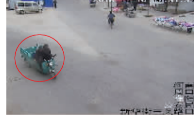
犯罪嫌疑人盗车行至新华街三义路口