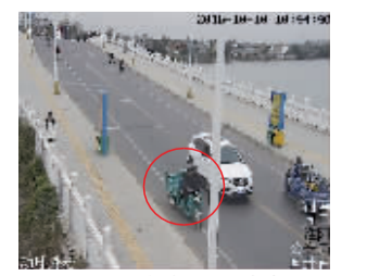
犯罪嫌疑人盗车行至神农桥