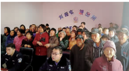
群众亲身体验乡镇视频监控平台。