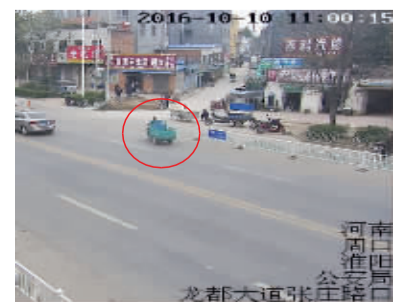
犯罪嫌疑人盗车行至龙都大道张庄路口