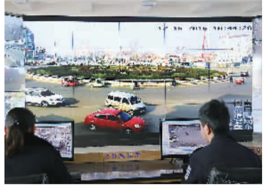
点击鼠标,放大视频。