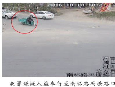
犯罪嫌疑人盗车行至南环路冯塘路口