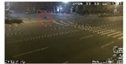
犯罪嫌疑人行至某中学门口