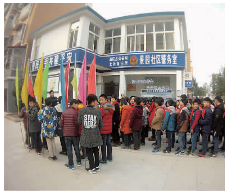
小学生排队参观社区监控平台。