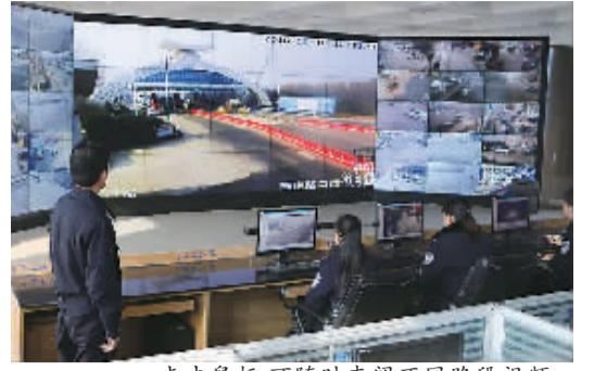
点击鼠标,可随时查阅不同路段视频。