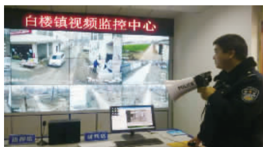
每个乡镇都建有视频监控平台。

正是“天网工程”的强大威力,该县公安机关利用“天网”监控破获盗窃抢案件200多起,查获交通事故视频信息500多条,搜集治安案件证据230多条。统计显示,淮阳县刑事案件发案率较去年同比下降17%,治安案件发案率同比下降50%,公众安全感和政法机关执法满意度不断攀升。