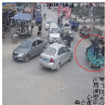
犯罪嫌疑人盗车行至鲁台街头

10月10日上午,在鲁台镇一超市门口,一村民刚买的电动三轮车被盗,接报警后,民警通过视频监控中心一路监控追踪:经鲁台、冯塘、县城南二环、新华街、东蔡河桥北出口至龙都大道张庄,又调取张庄“天网”监控,最终把两名嫌疑人抓获。