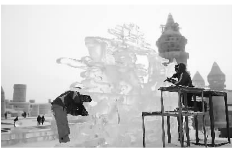
冰雕创作忙 1月3日,在哈尔滨冰雪大世界园区,选手在进行冰雕作品创作。当日,为期5天的第六届中国哈尔滨国际组合冰雕比赛进入收尾阶段,在哈尔滨冰雪大世界园区内,来自6个国家15支代表队的57名冰雕师的作品经过4天的雕琢已雏形初现。