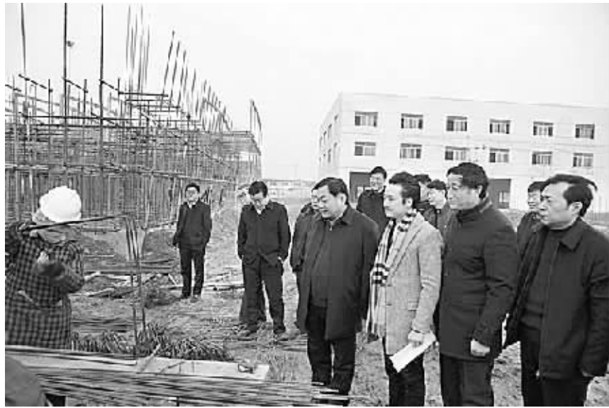
王国玺在产业集聚区润泰服饰工业园区现场。

本 报 讯 2016 年 12 月 30 日上午，太康县委书记王国玺到县产业集聚区润泰服饰工业园区现场办公，实地调研并召开座谈会。县政协党组书记王建林，县委常委、常务副县长张保华，县委常委、县委办公室主任董鸿以及县产业集聚区、财政局、农商行等相关部门主要负责同志陪同调研。