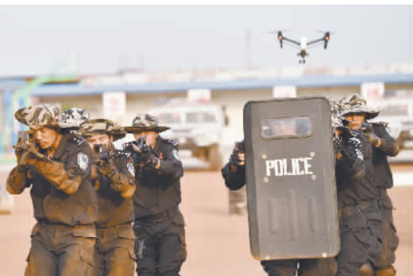
中国驻利比亚维和警察防暴队开展战术训练 1月17日,在利比亚蒙罗维亚,中国第四支驻利比亚维和警察防暴队开展战术训练。中国第四支驻利比亚维和警察防暴队17日开展捕歼战术训练,以过硬的战斗能力应对任务区严峻的治安形势。

至于如何治理环境污染,这位挪威籍的执行主任坦言,环境污染与许多挑战一样,具有复杂且各种因素相互关联的特点,不大可能用简单的方式在短期内解决。在他看来,推行绿色技术、发展绿色经济,从而创造绿色就业,并鼓励私营部门助力可持续发展,或许是一条可行的道路。 索尔海姆认为,推广绿色技术不仅可以缓解环境污染这一难题,还将为中国提供巨大的市场,“应该考虑将环保事业视为一种商机”。 索尔海姆呼吁继续加大对绿色技术的投入,开发风能和太阳能等可再生能源的潜力,从而找到持久的雾霾解决方案。他表示,相信中国会处理好空气污染问题。