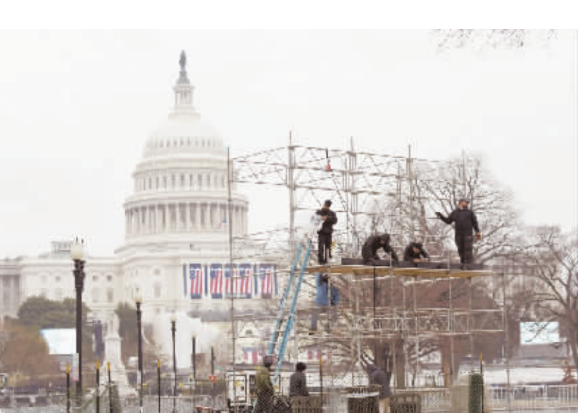
美国总统就职典礼紧张筹备 1月17日,工作人员在美国华盛顿国会大厦西侧安装看台,为总统就职典礼做准备。美国候任总统唐纳德·特朗普将于20日宣誓就任,目前各种准备工作仍在紧张进行中。据美国媒体此前报道,届时预计有70万至90万人涌入华盛顿,安全部门安排约28000名安保人员保护就职典礼安全。

到完成电子发射的全部训练过程。俄战略火箭部队在演习中将重点演练对来自空中和地面打击的反制,并反制敌方侦察部队的破坏行动。本次演习的重要任务之一是在夜间演练发现、锁定和反制敌方。 公告指出,2017年俄战略火箭部队将进行约150场战术和专门演习,并将重点进行多兵种协同训练,演习的次数将比2016年多50%。